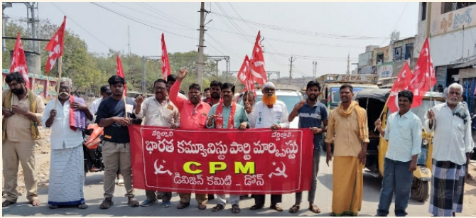
డోన్, ఫిబ్రవరి 21 (పీపుల్స్ మోటివేషన్):