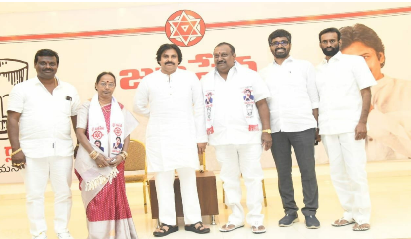
(మొదటి పేజీ తరువాయి)

అందరితో కలిసి ఉమ్మడి లక్ష్యం సాధించాలని కోరుకుంటామని అన్నారు. డబ్బులతో ఓట్లు కొనని రాజకీయం ఉన్నప్పుడే.. నిజమైన అభివృద్ధి ఉంటుందని అన్నారు. అప్పులు తెచ్చి బలంను నొక్కడం ఎందుకని.. అభివృద్ధి పనులు చేసేందుకు బలంను నొక్కాలని సూచించారు. 'జీరో బడ్జెట్ పాలిటిక్స్ అనేవి ఈ రోజుల్లో కుదరవు. 2019 ఎన్నికల్లో నేను ఆ మాట అన్నట్లుగా చెబుతున్నాను. ఎన్నోసార్లు చెప్పాను నేను ఆ మాట అనలేదు. ఎన్నికల సంఘం కూడా ఎన్నికల ఖర్చును రూ.45 లక్షలకు పెంచింది. డబ్బులు ఖర్చు చేయకుండా ఈ రోజుల్లో కుదరదు. ఎవరికి భోజనాలు పెట్టుకుండా రాజకీయాలు చేసేద్దామంటే అపదు. నాకైతే అభిమానులు వస్తారు. నాయకులకు ఇంత ముందు చెప్పా. డబ్బులు ఖర్చు పెట్టాలి. ఓట్లు కొనడంపై మీ నిర్ణయం మీదే. అందరూ దానిపై వేల కోట్లు ఖర్చు పెట్టి.. సైలెంట్ గా ఉంటారు. కనీసం 2029 తర్వాతైనా డబ్బులతో ఓట్లు కొనలేని రాజకీయం రావాలి. అప్పులు నిజమైన డెవలప్ మెంట్ జరుగుతుందన్నారు. సమాజాన్ని కలిపే వారినే జనం గుర్తు పెట్టుకుంటారు. ప్రాణత్యాగం చేయడం వల్లే పొట్టి శ్రీరాములు గుర్తు పెట్టుకుంటారు. వైకాపా ఎమ్మెల్యే అతడి కారు డ్రైవర్ ను చంపి డోర్ డెలివరీ చేశాడు. అనంతబాబు జైలు నుంచి బయటకు వచ్చినప్పుడు బాస్ ఈజ్ బ్యాక్ అన్నారు. సమాజానికి మనం ఏది ఇస్తే అదే