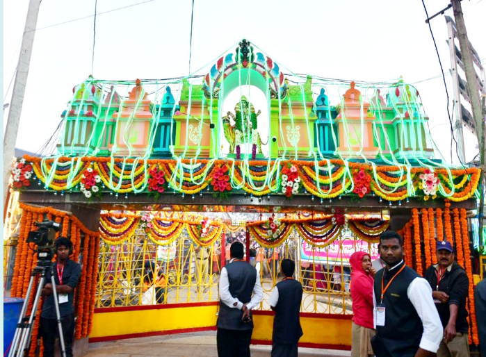
(మొదటి పేజీ తరువాయి)

సర్దు సన్నద్ధమైంది. బుధవారం సారలమర్చి రాకతో నాలుగు రోజుల జాతర షుభా అయ్యింది. ఈ మేరకు తెల్లవారుజాము నుంచే తల్లి కొలువైన కన్నెపల్లిలో కార్యక్రమాలు మొదలయ్యాయి. పొద్దున్నే సారలమ్మ ఆలయాన్ని శుద్ధి చేసి అలికి ముగ్గులతో అలంకరించారు. ప్రధాన పూజారి అయిన కాక సారయ్య పలు పూజా కార్యక్రమాలు నిర్వహించారు. సాయంత్రం ఆదివాసీ పూజారులు రహస్య పూజలు చేస్తారు. ఈ సమయంలోనే పూజారి సారయ్యను సారలమ్మ ఆవహిస్తుంది. తర్వాత సారలమ్మను (సారయ్య రూపంలో) ఆలయం నుంచి గృదెల వైపు పూజారులు తీసుకొస్తారు. రాత్రి పగడిద్దరాజు, గోవిందరాజులను కూడా గద్దెలపైకి తీసుకొస్తారు. మహాజాతర మొదలవనున్న వేళ మేడారం ఇప్పటికే జనసంద్రంగా మారిపోయింది. దారులన్నీ అటవైపే అన్నట్లుగా పరిస్థితి మారిపోయింది. సమృద్ధి గాల బిడ్డ అయిన సారలమ్మ ద్వైరానికి, వీరత్వానికి, త్యాగానికి ప్రతీక. 12వ శతాబ్దంలో తమ గిరిజన ప్రాంతాన్ని కాపాడుకునేందుకు కాకతీయులతో సారలమ్మ యుద్ధం సాగించిన తీరును, వీరమరణం ద్వారా ఆమె త్యాగాన్ని భక్తులు స్మరించుకుంటూ దైవంగా కొలుస్తారు. తల్లిని మొక్కితే సంతానం ప్రాప్తిస్తుందని, రుగ్మతలు పోతాయని భక్తుల విశ్వాసం. ఫలితంగా మేడారానికి సాగుతున్న సమయంలో సారలమ్మకు కన్నెపల్లిలో భక్తులు ఎదురెళ్లి మంగళహారతులు ఇస్తారు. సంతానం కలగాలని, సమస్యలు తీరాలని తడి బట్టలతో భక్తులు వరం పడతారు.