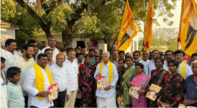
పొట్లూరు, ఫిబ్రవరి 21 (పీపుల్ మోటివేషన్):-