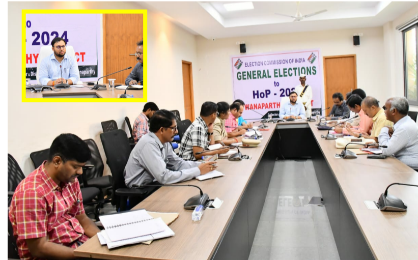
నవపల్లి, ఫిబ్రవరి 24 (పీపుల్స్ మోటివేషన్) :