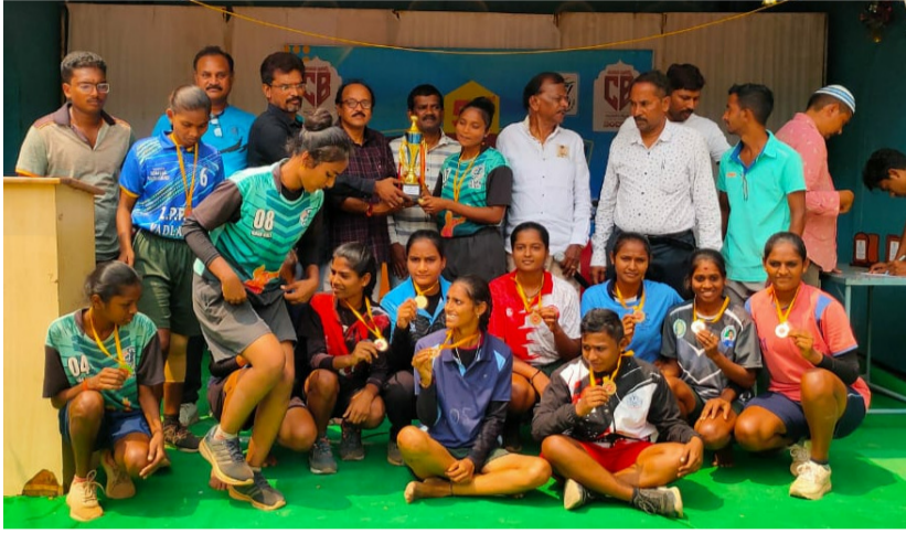
కర్నూలుకు రజతం, నంద్యాలకు కాంస్యం ముగిసిన రాష్ట్ర స్థాయి మహిళా హ్యాండ్ బాల్ ఛాంపియన్షిప్