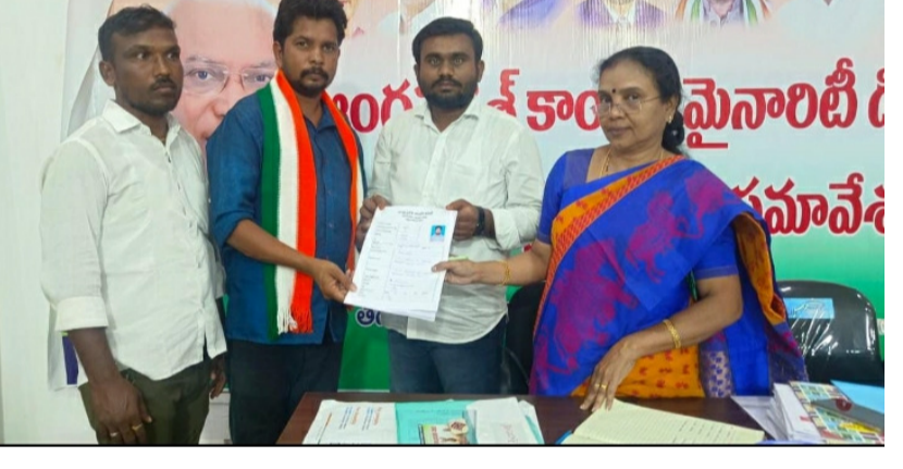
డోన్, ఫిబ్రవరి 24 (పీపుల్స్ మోటివేషన్):