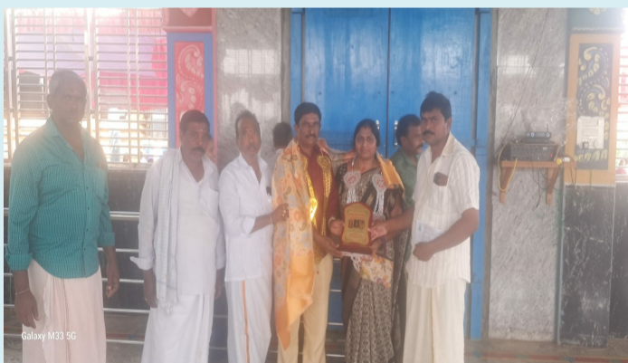
రుద్రవరం, ఫిబ్రవరి 24 (పీపుల్స్ మోటివేషన్):

ఆలయ అభివృద్ధికి విరాళము అంద చేస్తున్న దాతలు