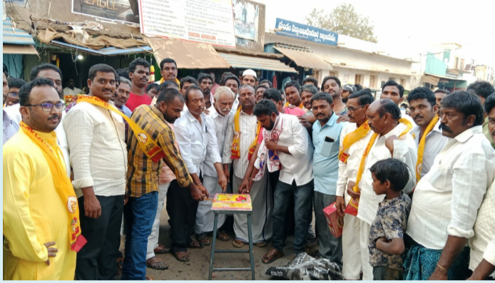
రుద్రవరం, ఫిబ్రవరి 24 (పీపుల్స్ మోటివేషన్):

● కేకే ను కట్ చేసి సంబరాలు జరుపుకుంటున్న టిడిపి, జనసేన నాయకులు, కార్యకర్తలు