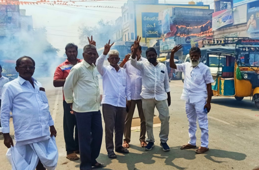
జేతంపల్లె, ఫిబ్రవరి 24 (పీపుల్స్ మోటివేషన్):

తెలుగుదేశం పార్టీ అధినేత మాజీ ముఖ్యమంత్రి నారా చంద్రబాబు నాయుడు, జనసేన పార్టీ అధినేత పవన్ కళ్యాణ్ లు 2024 ఎన్నికలకు సంబంధించి రాష్ట్రంలో 94 అసెంబ్లీ స్థానాలకు అభ్యర్థులను ప్రకటించడం జరిగింది. అందులో నంద్యాల జిల్లా డోన్ అసెంబ్లీ స్థానం మాజీ