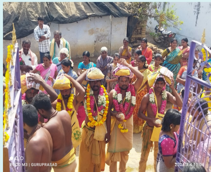
నంద్యాల/రుద్రవరం, మార్చి 04 (పీపుల్స్ మోటివేషన్):

• ఇరుముడులతో బయలుదేరిన శివ స్వామి మాల భక్తులు