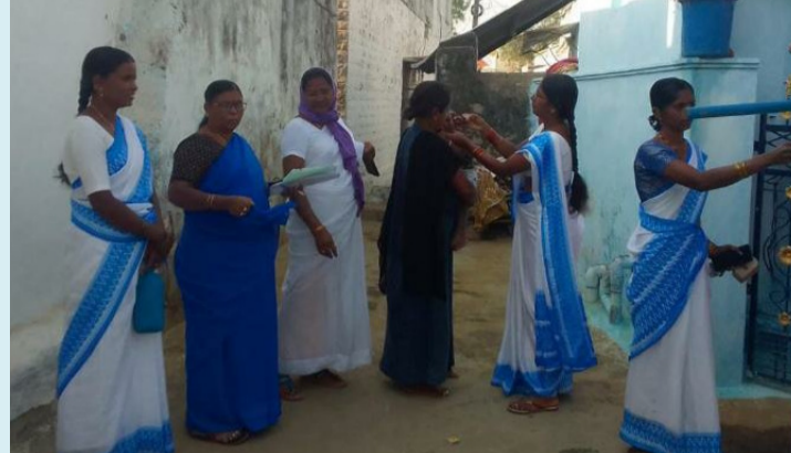
పెజ్జెర్, మార్చి 04 (పీపుల్స్ మోటివేషన్):-