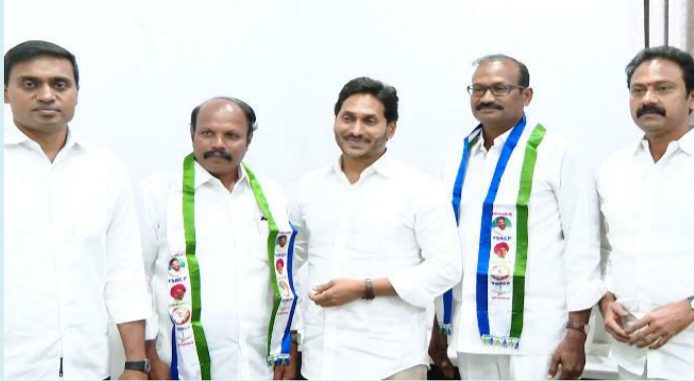
అమరావతి, మార్చి 4 (పేపుల్ మోటివేషన్) :

● గజగన్ సమక్షంలో ఆళ్లగడ్డ బిజెపి నేతల చేరిక