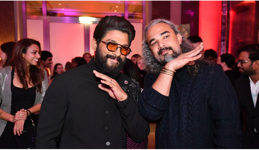
సాత్..నార్త్ తేడా లేదన్న బస్సు

మేము మేము మేము బాగానే ఉంటాం. మీరు కూడా కలిసికట్టుగా ఉండాలని తరచూ స్టార్ హీరోలు ఫ్యాన్స్ కు హితబోధ చేస్తుంటారు. పరిశ్రమలో హీరోల మధ్య పోటీ ఉన్నా లేకున్నా సోషల్ మీడియాలో ఫాన్స్ మధ్య వార్, లేదా సాత్ ఇండస్ట్రీ వర్సెస్ బాలీవుడ్ ఇండస్ట్రీ అని ఎప్పుడూ వాదన జరుగుతూనే ఉంటుంది. ఎన్నో సందర్భాల్లో ఈ విషయాలపై హీరోలు కూడా స్పందించారు. కళకు భాష, ప్రాంతాల తేడా ఉండదని చెబుతుంటారు. తాజాగా ఓ పోలో పాల్గొన్న ఐకాన్ స్టార్ అల్లు అర్జున్ కూడా ఈ అంశంపై స్పందించారు. ఆరు దశాబ్దాల బాలీవుడ్ మంచి సినిమాలతో ప్రేక్షకుల్ని అలరించింది. ప్రస్తుతం హిట్ రేట్ తగ్గిందని పరిశ్రమను విమర్శించడం సరికాదు. దక్షిణాది, ఉత్తరాది అన్న తేడా లేదు. రెండూ సోదర భావంతో గౌరవించుకుంటున్నాయి. సాత్ సినిమాల ప్రభావం నార్త్ పై ఉన్నట్లు అక్కడి సినిమాల ప్రభావం కూడా ఇక్కడ ఉంటుంది. అంతే కానీ సాత్, నార్త్ అని భేదం లేదు. మంచి సినిమా ఏ భాషలో విడుదల చేసినా ఆడుతుందని అల్లు అర్జున్ తెలిపారు. ప్రస్తుతం అల్లు అర్జున్ 'పుష్ప-2' చిత్రంతో బిజీగా ఉన్నారు. వైజాగ్ పరిసర ప్రాంతాల్లో చిత్రీకరణ జరుగుతోంది. సుకుమార్ దర్శకత్వంలో మైత్రీ మూవీ మేకర్స్ నిర్మిస్తున్న ఈ చిత్రంలో రమ్యక మందన్నా కథానాయిక. ఫహాద్ ఫాజిల్, ధనుంజయ, సునీల్, అనసూయ తదితరులు కీలక పాత్రధారులు. ఆగస్టు 15న విడుదల కానుంది.