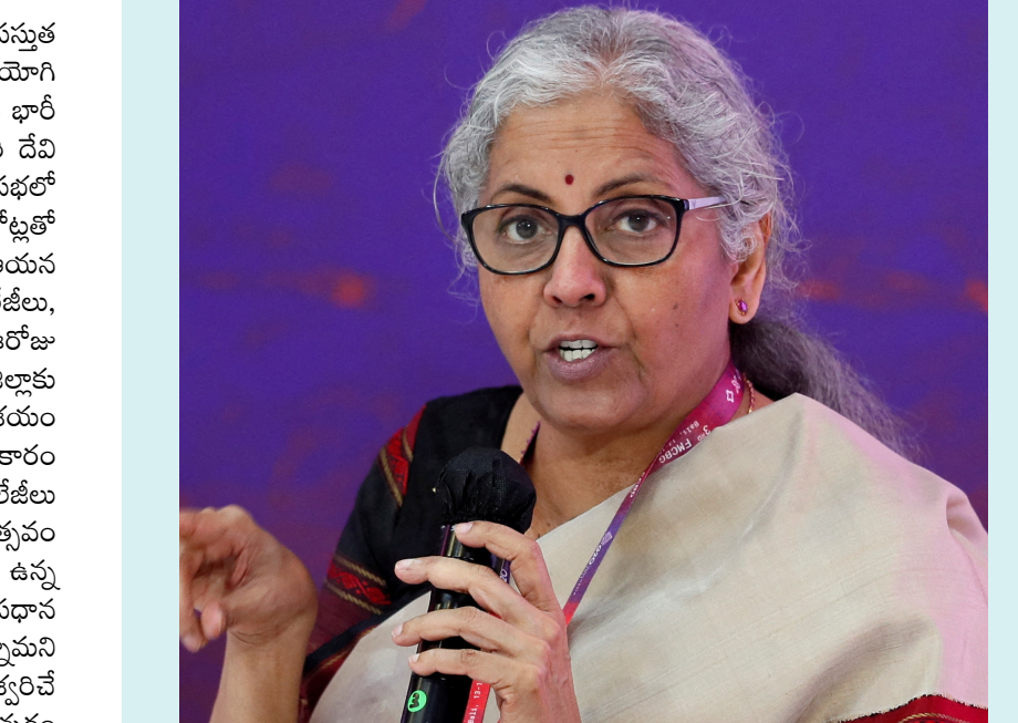
న్యూఢిల్లీ, మార్చి 15 (పీపుల్స్ మోటివేషన్):

● కేంద్ర ఆర్థిక మంత్రి నిర్మలా సీతారామన్