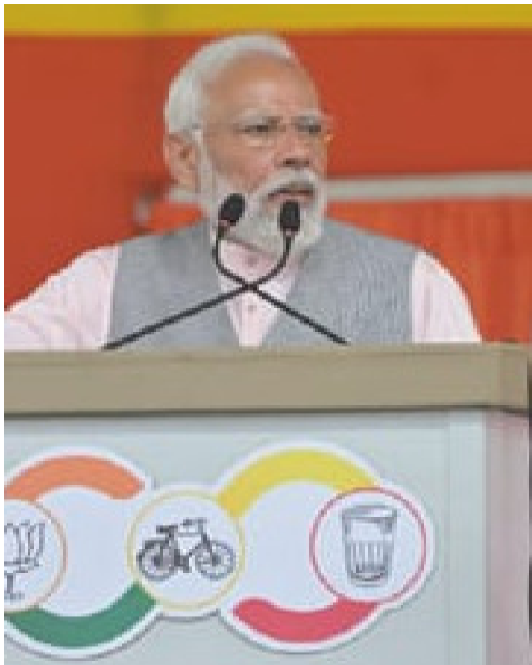
● ప్రధాని నరేంద్ర మోదీ

అమరావతి, మార్చి 17 (పీపుల్స్ మోటివేషన్):