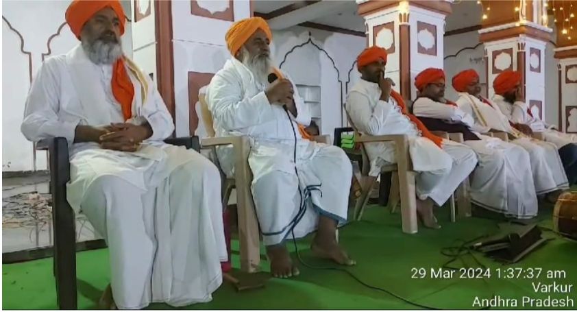
29 Mar 2024 1:37:37 am Varkur Andhra Pradesh