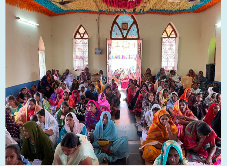
నంద్యాల /రుద్రవరం, మార్చి 29 (పీపుల్స్ మోటివేషన్):-

మండలంలోని పలు గ్రామాలలో శుక్రవారం ఘనంగా గుడ్ ఫ్రైడే వేడుకలు నిర్వహించారు. ఈ సందర్భంగా పలువురు క్రైస్తవ పాస్టర్ లు మాట్లాడుతూ క్రమాగుణం దయామయ జీవనం సాధ్యత, ఏసుక్రీస్తు మానవాళికి చేసిన మార్గం మానవులు చేసిన పాపాల కోసం ఏసుక్రీస్తు శిలువపై ప్రాణాలు అర్పించారు. తిరిగి మూడో రోజు సమాధి నుంచి లేచారు. పొరుగు వారిని ప్రేమించాలని వారి తప్పులను క్షమించాలని బోధించారు. క్రైస్తవ మత విశ్వాసం ప్రకారం క్రీస్తు శుక్రవారం సిలువ వేయబడ్డారు. ఈ నేపథ్యంలో క్రీస్తు ప్రభుత్వం స్థాపించుకుంటారు. దయామయుడని తలుస్తూ ఉపవాస వ్రాధనలు చేశారు. ఈ ప్రార్థనలో పలువురు క్రైస్తవ పెద్దలు పాల్గొన్నారు.