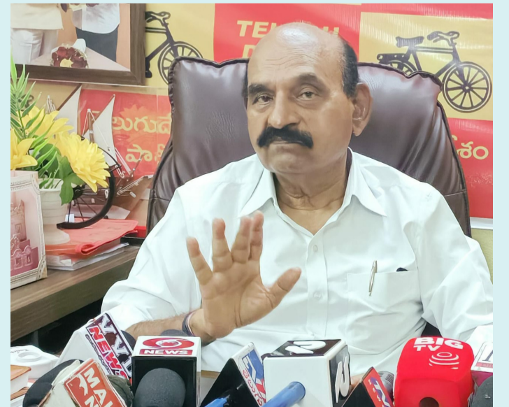
నంద్యాల, మార్చి 29 (పీపుల్స్ మోటివేషన్): -