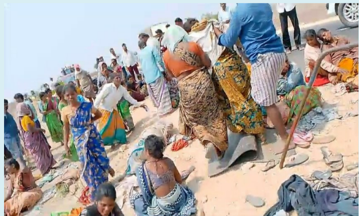
అలూరు, మార్చి 30 (పీపుల్స్ మోటివేషన్):-

దినసరి కులియే జీవనాధారం...బోల్తా పడ్డ వాహనం కులీలకు గాయాలు