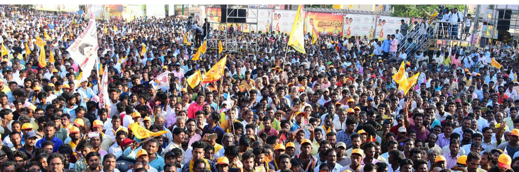
అధికారంలోకి రాగానే మోగా డీఎస్సీ వేస్తూ శ్రీకాళహస్తి ప్రజాగళం సభలో చంద్రబాబు శ్రీకాళహస్తి, మార్చి 30 (పీపుల్స్ మోటివేషన్) :