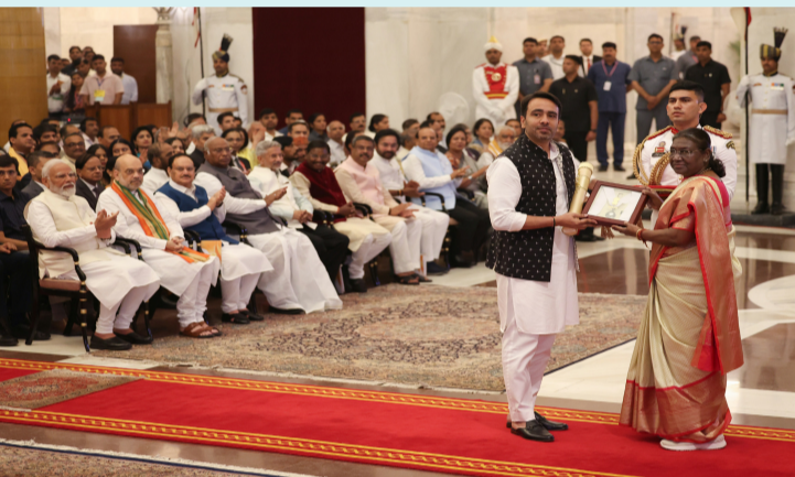
న్యూఢిల్లీ, మార్చి 30 (పీపుల్స్ మోటివేషన్) :