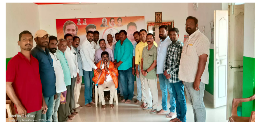
● పార్టీ విధేయతకు గుర్తింపు