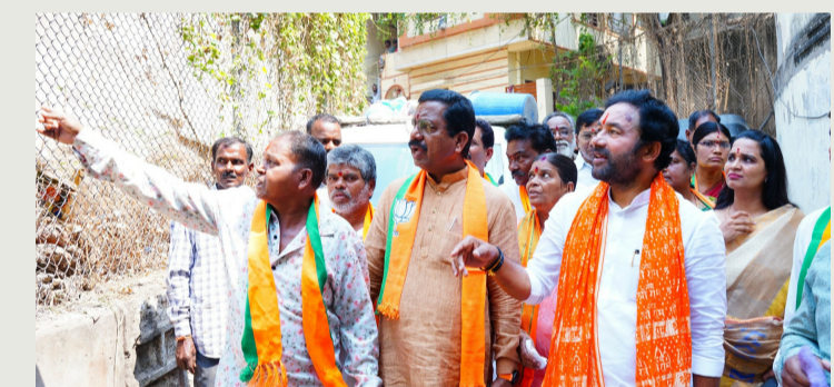
హైదరాబాద్, ఏప్రిల్ 1(పీపుల్స్ మోటివేషన్):