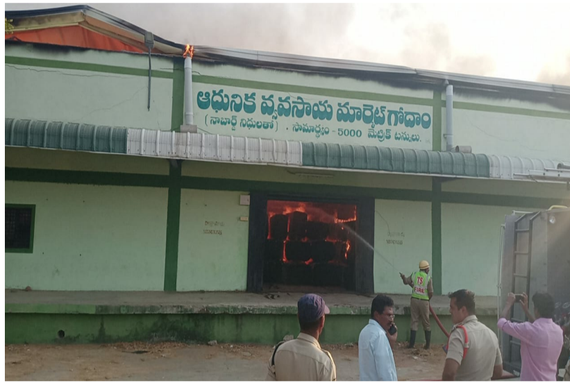
మంటలు అదుపు చేయడానికి ప్రయత్నిస్తున్న వాటర్ ఫైర్ ఇంజన్లు