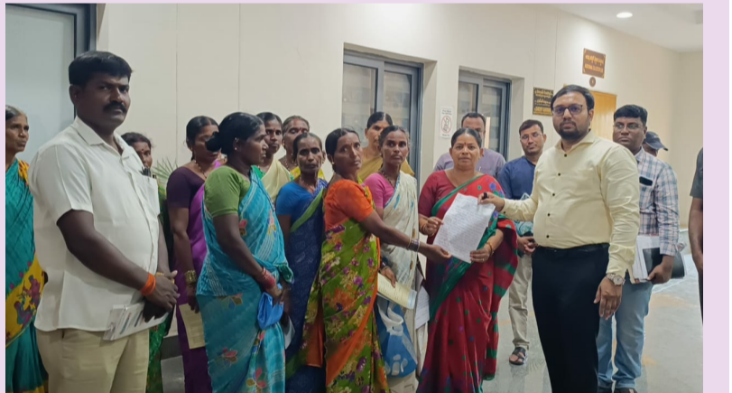
శ్రీరంగాపూర్/పనపర్తి, ఏప్రిల్ 01 (పేపుల్ మోటివేషన్):-