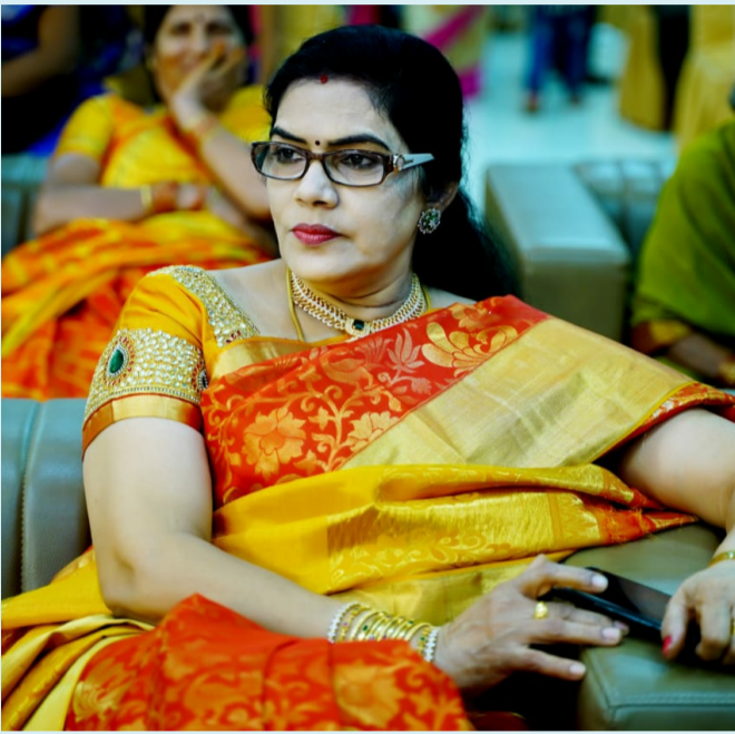
శ్రీకాకుళం, ఏప్రిల్ 3 (పీపుల్స్ మోటివేషన్) :