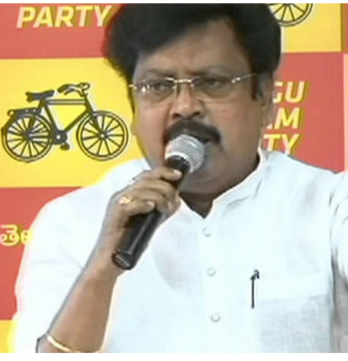
అమరావతి, ఏప్రిల్ 3 (పీపుల్స్ మోటివేషన్) :