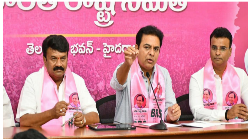
తెలంగాణ, ఏప్రిల్ 3 (పీపుల్స్ మోటివేషన్) :