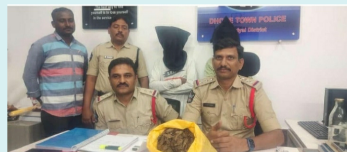
డోన్, ఏప్రిల్ 04 (పీపుల్స్ మోటివేషన్):-