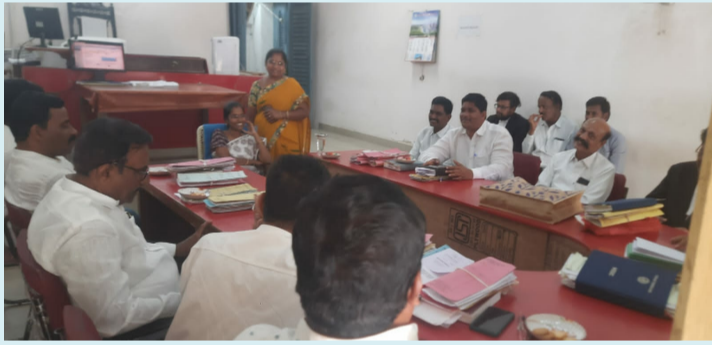
పత్తికొండ, ఏప్రిల్ 04 (పేపుల్ మోటివేషన్):-