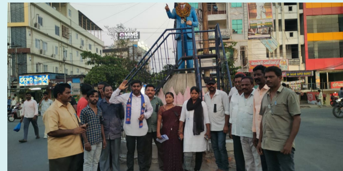
భద్రాచలం, ఏప్రిల్ 04 (పీపుల్స్ మోటివేషన్):

● అంబేద్కర్ సెంటర్లో నల్ల బ్యాడ్జీలతో నిరసన తెలిపిన మాదిగ సంఘాలు