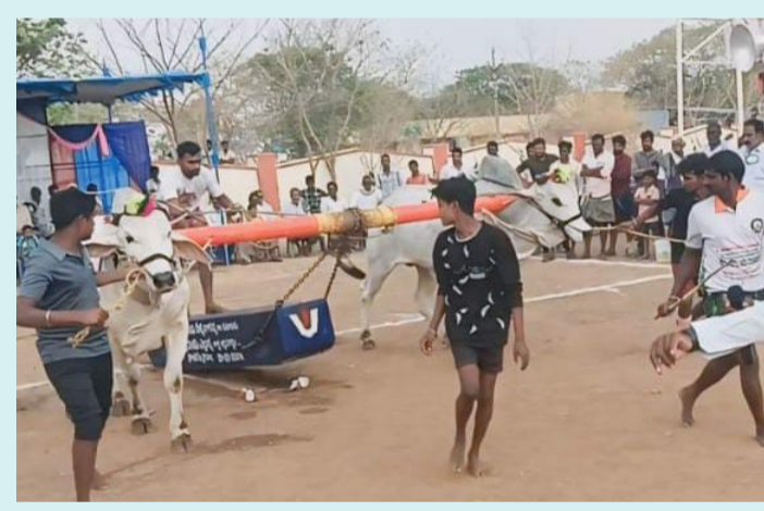
పాణ్యం, ఏప్రిల్ 04 (పీపుల్స్ మోటివేషన్):-

మండలం ఎన్ కొత్తూరు సుబ్రహ్మణ్యేశ్వర స్వామి దేవస్థానం ఆధ్వర్యంలో ఉగాది పండుగ సందర్భంగా బుధవారం ఆరు పల్లవి భాగం పెద్ద బండ బండలాగుడు పోటీలు నిర్వహించినట్లు ఆయన కమిటీ సభ్యులు తెలిపారు. వారు మాట్లాడుతూ ఈ పోటీలో గెలుపొందిన ఎద్దుల యజమానులకు వరుసగా మొదటి బహుమతి రూ. 50,000 , రెండవ బహుమతి 40,000, మూడవ బహుమతి 30,000, నాలుగో బహుమతి 25,000 చొప్పున దాతల సహకారంతో బహుమతులు ప్రధానం చేయనున్నట్లు వారు తెలిపారు.