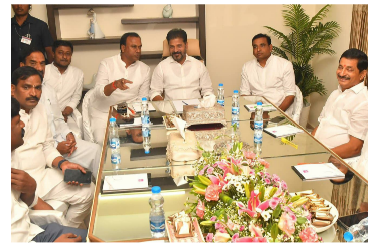
హైదరాబాద్, ఏప్రిల్ 10 (పీపుల్స్ మోటివేషన్) :