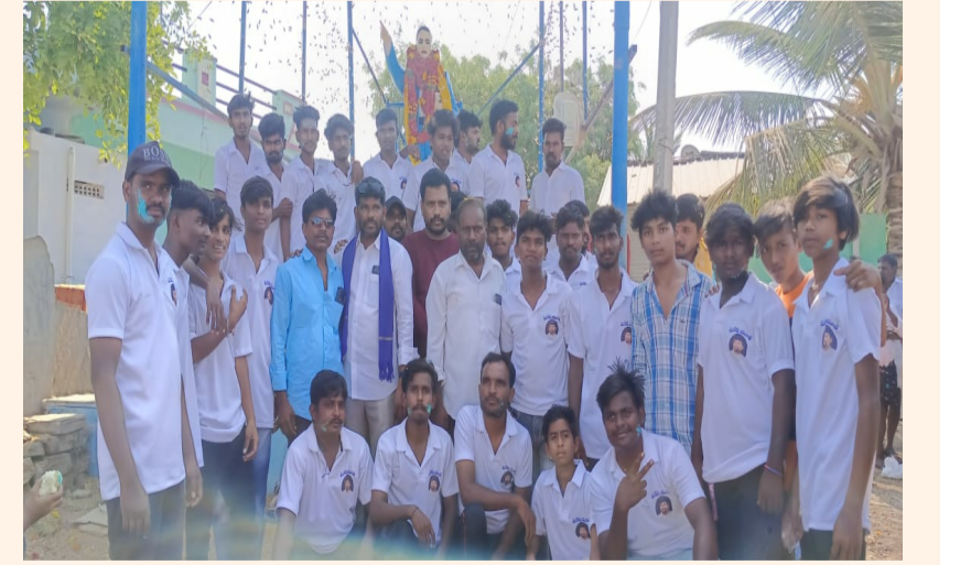
మిడుతూరు, ఏప్రిల్ 14 (పీపుల్స్ మోటివేషన్):-