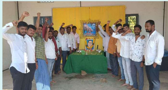
పెళ్ళేరు, ఏప్రిల్ 14 (పీపుల్స్ మోటివేషన్):-