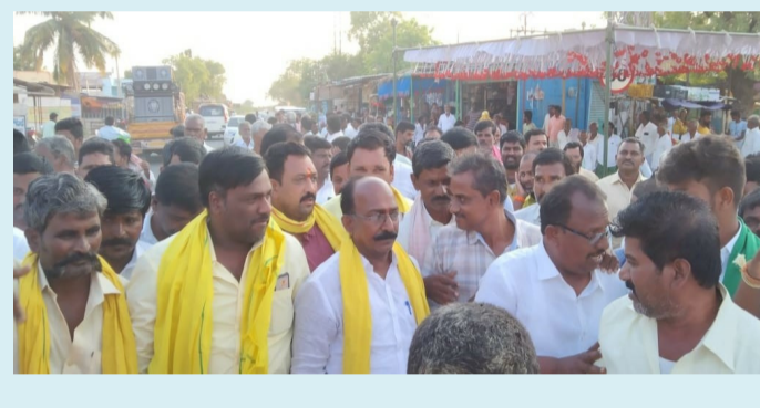
హోలహర్షి/ ఆలూరు, ఏప్రిల్ 14 (పీపుల్స్ మోటివేషన్):-