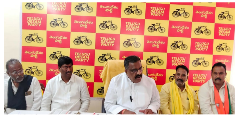
హోలహర్షి/ ఆలూరు, ఏప్రిల్ 14 (పీపుల్స్ మోటివేషన్):-

ఆసుపత్రికి వెళ్లడం మొత్తం ద్రామాలో భాగమేనని ఆయన అన్నారు. ఘటన జరిగిందని చెప్పిన నాలుగైదు నిమిషాలకే క్యూట్ బాల్ తో దాడి చేశారని వారి సొంత మీడియాలో ప్రచారం చేసుకున్నారని ఆయన తెలిపారు. అంత తొందరగా వారి మీడియాలో ఎలా తెలిసిందని ఆయన ప్రశ్నించారు. దాడి జరిగిన సమయంలో అక్కడే ఉన్న వైసిపి కార్యకర్తలు, పోలీసులు నిందితుడిని ఎందుకు పట్టుకోలేకపోయారో వారే చెప్పాలని ఆయన అన్నారు. తన పాలనలో తనకే రక్షణ కల్పించుకోలేకపోయిన జగన్ ముఖ్యమంత్రి పదవికి అనర్హుడని అభిప్రాయపడ్డారు. జగన్ గత అయిదేళ్ల పాలనలో ప్రజలకు చెప్పకోవడానికి ఒక్క మంచి పని కూడా లేకపోవడంతో ఆయన పర్యటనల్లో జనాల నుంచి స్పందన లేకపోగా పూర్తి స్థాయి వ్యతిరేకత కనిపించిందని కోట్ల అన్నారు. దీంతో కొత్త ద్రామా ఆడక తప్పలేదని విమర్శించారు. అనుభవ రాహిత్యం, అవినీతి, అక్రమాలతో గత అయిదేళ్లలో రాష్ట్రాన్ని సర్వ నాశనం చేశాడని మండిపడ్డారు. అరాచక పాలనతో భవిష్యత్తును అగాధంలోకి నెట్టేశారని ఆవేదన వ్యక్తం చేశారు. ఇలాంటి వ్యక్తి జగన్ చేసే చిల్లర రాజకీయాలను ప్రజలు సమర్థించిన ఆయన కోరారు. జగన్ ను పదవి నుంచి దించేందుకు ఎన్.డి.వి. అభ్యర్థులను గెలిపించేందుకు ప్రజలు భారీ సంఖ్యలో ఓట్లు వేయాలని ఆయన విన్నవించారు.