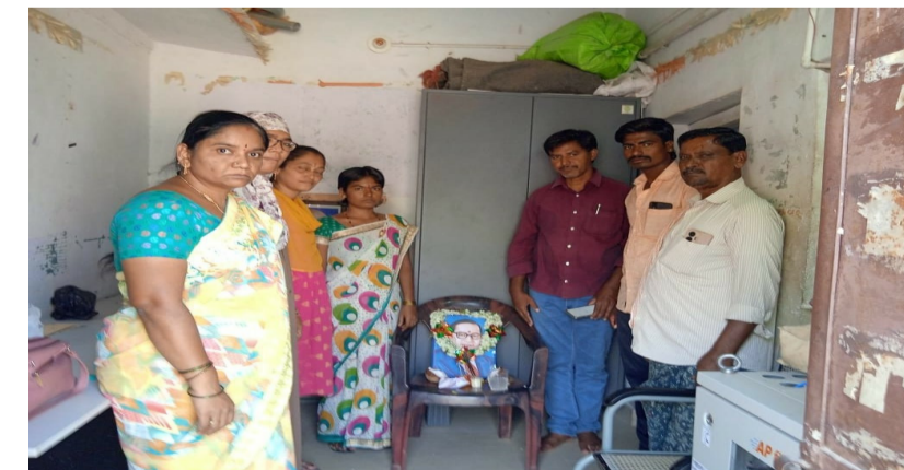
దేవనకొండ, ఏప్రిల్ 14 (పీపుల్స్ మోటివేషన్):-

దేవనకొండ మండలంలోని కుంకనూరు గ్రామ సచివాలయ పరిధిలో అంబేద్కర్ జయంతి నిర్వహించడం జరిగింది. అంబేద్కర్ జయంతి సందర్భంగా అంబేద్కర్ పటానికి పూల మాలలు వేసి నివాళులర్పించారు సచివాలయ సిబ్బంది ఈ సందర్భంగా మాట్లాడుతూ రాజ్యాంగ స్ఫూర్తితో అంబేద్కర్ సేవలను కొనియాడారు అందుగా అంబేద్కర్ అంబేద్కర్ రాజ్యాంగాన్ని రచించి అందరికీ సమాన హక్కులు కల్పించారు స్వేచ్ఛ సమానత్వం కల్పించారు అని తెలిపారు అంబేద్కర్ అడుగుజాడల్లో నడిచి దేశాభివృద్ధికి కృషి చేయాలని తెలిపారు ఈ కార్యక్రమంలో గ్రామ సర్పంచ్ మరియు సచివాలయ సిబ్బంది పాల్గొన్నారు.