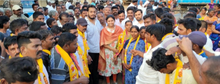
నంద్యాల/ఉద్రవరం, ఏప్రిల్ 14 (పీపుల్స్ మోటివేషన్):-

• వైస్సార్సీపీ నుండి టీడీపీ లోకి 100 కుటుంబాలు చేరిక..