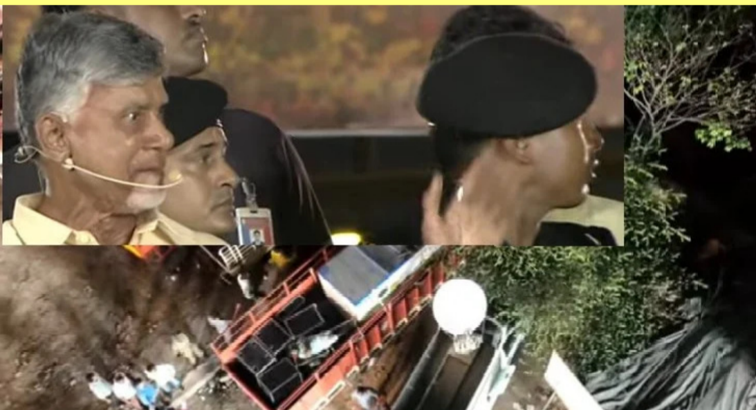
ప్రసంగం ఆపారు. వాళ్లు దొరికితే తరిమి తరిమి దొరికాడా లేదా అని చంద్రబాబు అడిగారు. క్షేమార్ మైన్స్ కే భయపడలేదు... ఈ రాళ్లకు భయపడతానా? అని వ్యాఖ్యానించారు.

టీడీపీ అధినేత చంద్రబాబు గాజువాక ప్రజాగళం సభలో ప్రసంగిస్తుండగా అనూహ్య సంఘటన చోటుచేసుకుంది. ఓ వ్యక్తి ప్రజాగళం వాహనం వెనుక వైపు నుంచి చంద్రబాబుపైకి రాయి విసిరి పారిపోయాడు. రాయి విసిరిన ఆగంతుకుడి కోసం పోలీసులు గాలిస్తున్నారు. దీనిపై చంద్రబాబు స్పందించారు. మొన్న సీఎం జగన్ పై చీకట్లో గులకరాయి పడిందని, ఇవాళ తనపై కరెంటు ఉన్నప్పుడే రాయి పడిందని అన్నారు. గంజాయి బ్యాచ్, షేడ్ బ్యాచ్ రాళ్లు వేస్తున్నారని చంద్రబాబు ఆరోపించారు. విజయవాడలో జరిగిన ద్రామా గురించి కూడా తెలుస్తూ అని హెచ్చరించారు. నిన్ను తెనాలిలో పవన్ కల్యాణ్ పై కూడా చేతకాని పిరికిపందలు రాళ్లు వేశారని ఆగ్రహం వ్యక్తం చేశారు. గత ఎన్నికలప్పుడు నాపై కూడా రాళ్లు వేశారు అని చంద్రబాబు వెల్లడించారు. "నిన్ను జగన్ సభ సమయంలో కరెంట్ పోయింది... సీఎం సభలో కరెంట్ పోతే ఎవరు బాధ్యత వహించాలి? జగన్ ఒకప్పుడు కోడికత్తి ద్రామా ఆడారు. బాబాయ్ హత్యను నాపైకి నెట్టాలని ప్రయత్నించారు" అంటూ చంద్రబాబు ధ్వజమెత్తారు. కాగా, రాయి పడడంతో చంద్రబాబు