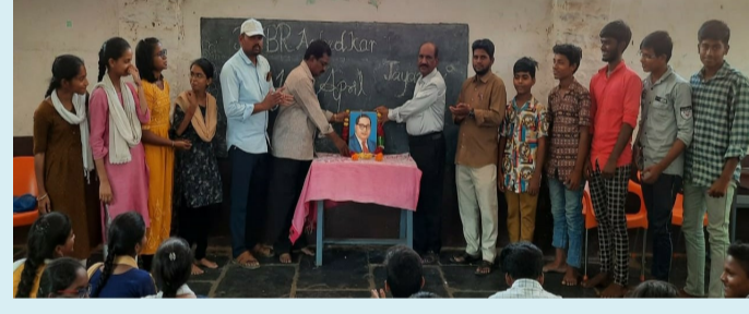
పత్తికొండ, ఏప్రిల్ 14 (పీపుల్స్ మోటివేషన్):-