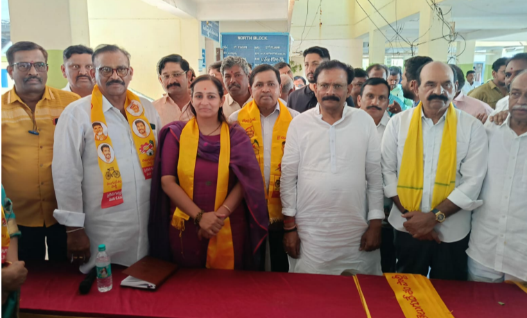
నంద్యాల, ఏప్రిల్ 14 (పీపుల్స్ మోటివేషన్):-