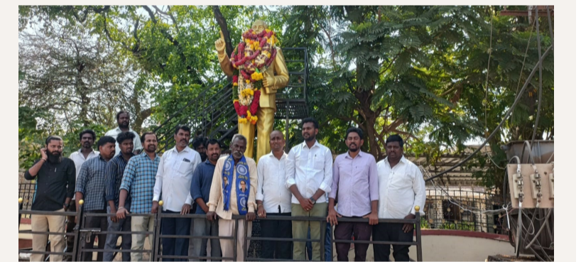
బేతంపల్లె, ఏప్రిల్ 14 (పీపుల్స్ మోటివేషన్):-

రాజ్యాంగ నిర్మాత స్ఫూర్తితో డాక్టర్ బి.ఆర్ అంబేద్కర్ సేవలను కొనియాడుదామని వివిధ రాజకీయ పార్టీల నాయకుల వివిధ దళిత సంఘాల నాయకులు అన్నారు భారతరత్న డాక్టర్ బి.ఆర్ అంబేద్కర్ జయంతిని పురస్కరించుకొని ఆదివారం పట్టణంలోని కమ్యూనిటీ హాల్ సెంటర్ నందు ఉన్న ఆయన విగ్రహానికి పూలమాలలు వేసి నివాళులర్పించారు యువత అంబేద్కర్ అడుగుజాడలలో నడిచి దేశ అభివృద్ధికి కృషి చేయాలన్నారు అలాగే మరెక్కంట గ్రామంలో డాక్టర్ బి.ఆర్ అంబేద్కర్ జయంతి వేడుకలు ఘనంగా నిర్వహించారు.