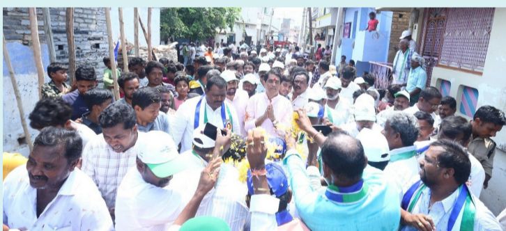
బేతంపల్లె, ఏప్రిల్ 21 (పీపుల్స్ మోటివేషన్):