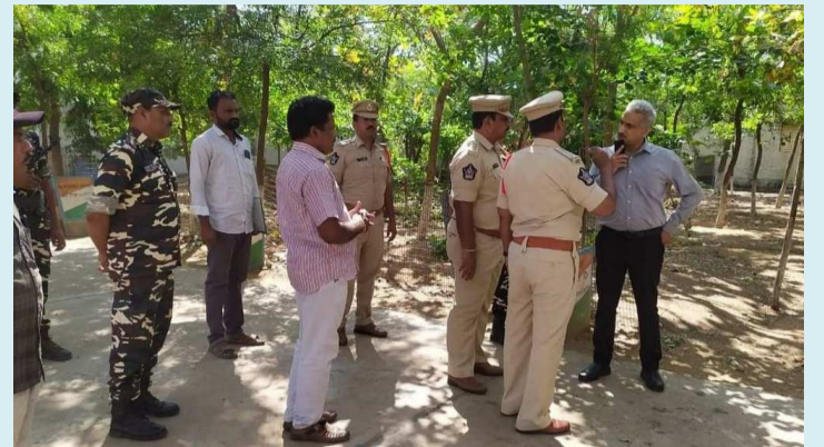
పత్తికొండ, ఏప్రిల్ 26 (పీపుల్స్ మోటివేషన్):-