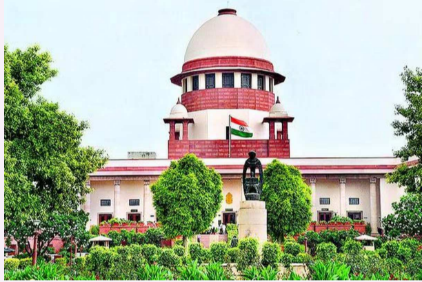
న్యూఢిల్లీ, ఏప్రిల్ 26 (పీపుల్స్ మోటివేషన్) :