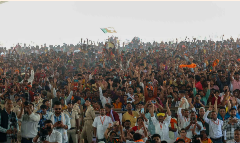
పాట్నా, ఏప్రిల్ 26 (పీపుల్స్ మోటివేషన్) :

ఈవీఎం-వీవీప్యాట్ల పై సుప్రీంకోర్టు బలమైన తీర్పు ఇచ్చిందని, పేపర్ బ్యాలెట్ రూపంలో పాత పద్ధతిలో ఎన్నికలు నిర్వహించాలన్న వాదనను తోసిపుచ్చిందని ప్రధానమంత్రి నరేంద్ర మోదీ అన్నారు. ఈరోజు ప్రజాస్వామ్యానికి ఎంతో శుభ దినమని అన్నారు. భారత రాజ్యాంగాన్ని కాంగ్రెస్, ఆర్డీడీ ఎప్పుడూ గౌరవించలేదని విమర్శలు గుప్పించారు. బీహార్ లోని అరారియాలో శుక్రవారంనాడు జరిగిన ఎన్నికల ప్రచార సభలో ప్రధాని మాట్లాడుతూ, బీహార్లో గత పాటలకు హయాంలో బూత్ క్యాన్పురింగ్ అనేది సర్వసాధారణ విషయంగా ఉండేదన్నారు. కాంగ్రెస్ పార్టీ ఓటిసీ కోటా కిందకు బీహార్ ముస్లింలను తీసుకురావాలని యోచనలో ఉందని కూడా ప్రధాని ఆరోపించారు. రాజ్యాంగాన్ని కానీ,