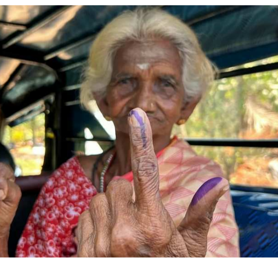
న్యూఢిల్లీ, ఏప్రిల్ 26 (పీపుల్స్ మోటివేషన్) :

దేశవ్యాప్తంగా 13 రాష్ట్రాలు, కేంద్ర పాలిత ప్రాంతాల్లోని 88 పార్లమెంటరీ నియోజకవర్గాల్లో రెండోవిడత పోలింగ్ పూర్తయింది. మధ్యాహ్నం 3 గంటల వరకు ఎన్నికల కమిషన్ ఇచ్చిన సమాచారం మేరకు త్రిపురలో గరిష్టంగా 68.92 శాతం పోలింగ్ నమోదు కాగా, మహారాష్ట్రలో కనిష్టంగా 43.01 శాతం పోలింగ్ నమోదైంది. కాగా, అసోంలో 60.32 శాతం, బీహార్లో 44.24 శాతం, ఛత్తీస్ గఢ్లో 63.32 శాతం పోలింగ్ నమోదైంది.