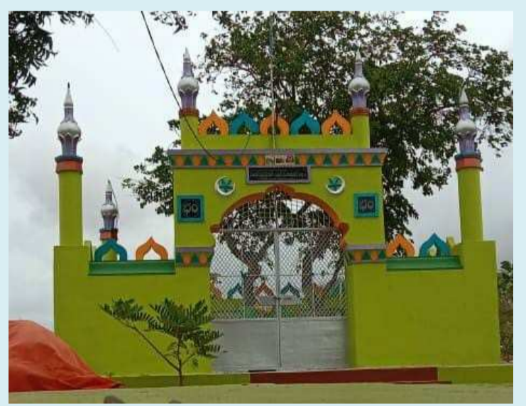
పత్తికొండ, ఏప్రిల్ 26 (పీపుల్స్ మోటివేషన్):-