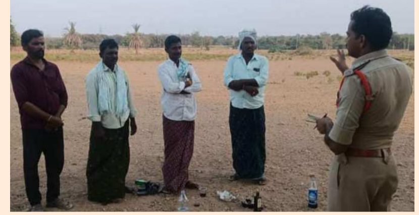
శ్రీరంగాపూర్ /పనపర్తి, ఏప్రిల్ 26 (పీపుల్స్ మోటివేషన్):-