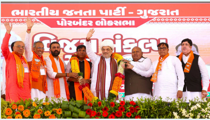
పోరుబందర్, ఏప్రిల్ 27 (పేపుల్స్ మోటివేషన్):