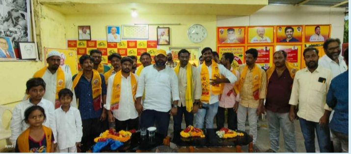
నంద్యాల, ఏప్రిల్ 27 (పీపుల్స్ మోటివేషన్):-