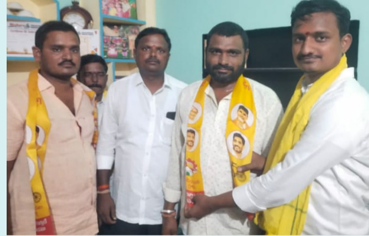
దేవనకొండ, ఏప్రిల్ 29 (పీపుల్స్ మోటివేషన్) :-

● అలూరు దీన్నే గ్రామంలో వైసీపీ నుంచి టిడిపిలోకి చేరిక