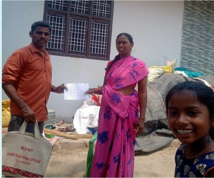
నెక్కొండ, ఏప్రిల్ 30 (పీపుల్స్ మోటివేషన్) :

మే నెల 13న జరిగే పార్లమెంట్ ఎన్నికల లో ఓటర్లకు ఓటర్ స్లిప్పులను ప్రభుత్వం బిఎల్ఓ ల ద్వారా పంపిణీ చేస్తుంది ఇందులో భాగంగా వరంగల్ జిల్లా నెక్కొండ మండలంలోని 39 గ్రామపంచాయతీలలో 54 పోలింగ్ బూత్ లలో బిఎల్ఓలు ఇప్పటికే 60% ఓటర్ స్లిప్పులను శరవేగంగా పంపిణీ చేశారని రెవెన్యూ అధికారులు తెలిపారు. 54 బూత్ లలో 23233 మహిళా ఓటర్లు కాగా 22412 పురుష ఓటర్లు మొత్తం మండలంలో 45647 ఓటర్లు ఉన్నారని వీటితోపాటు రెండు ట్రాన్స్ జెండర్ల ఓటర్లు ఉన్నారని రెవెన్యూ అధికారులు తెలిపారు.