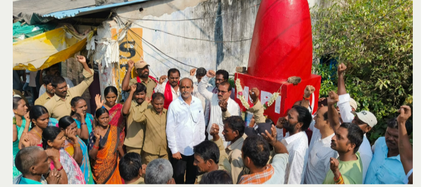
నెక్కొండ, మే 01 (పేపుల్స్ మోటివేషన్): -