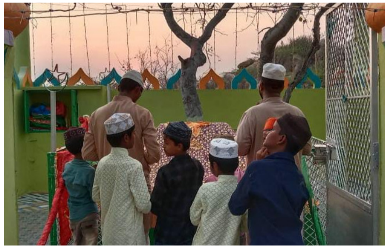
పత్తికొండ, మే 01 (పేపుల్స్ మోటివేషన్): -