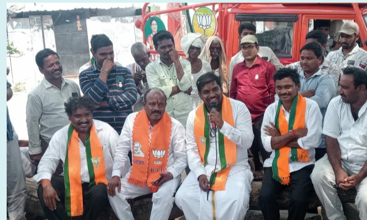
పెళ్ళేరు, మే 01 (పేపుల్స్ మోటివేషన్): -

● విజయ సంకల్ప యాత్రలో కమల పువ్వు పై ఓటు వేయాలని పిలుపు