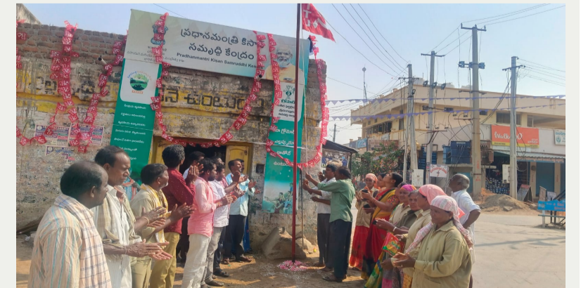
శ్రీరంగాపూర్ / పనపర్తి, మే 01 (పేపుల్స్ మోటివేషన్): -

శ్రీరంగాపూర్ మండల కేంద్రంలోని అంబేద్కర్ చౌరస్తా దగ్గర "మేడే" సందర్భంగా సిబిటియూ జెండావిప్పుణ కార్యక్రమాన్ని శ్రీరంగాపూర్ మండల కార్మికులు నిర్వహించడం జరిగింది, ఈ కార్యక్రమంలో గ్రామ పంచాయతీ కార్మికులు, అంగన్వాడీ ఉద్యోగులు, ఆశాపర్వర్తి, ఆలోద్రైవర్లు, భవన నిర్మాణ కార్మికులు, హమాలీలు తదితరులు పాల్గొన్నారు.