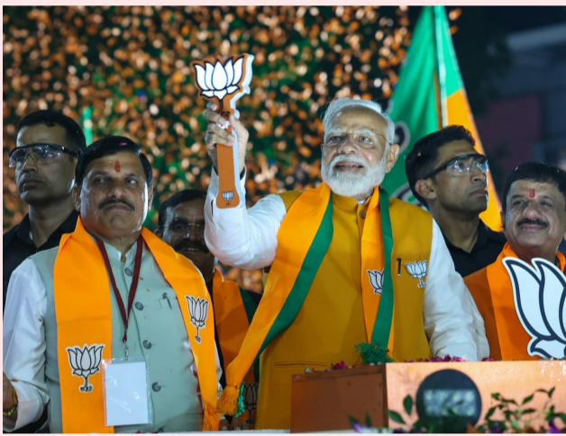
వారణాసి, మే 01 (పీపుల్స్ మోటివేషన్):