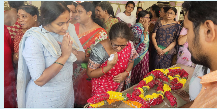
మహానంది/ నంద్యాల, మే 05 (పీపుల్స్ మోటివేషన్):

ప్రసిద్ధ రచయిత, తెలుగు ఉపాధ్యాయురాలుకు ఘన నివాళి అర్పించిన బైరెడ్డి శబరి