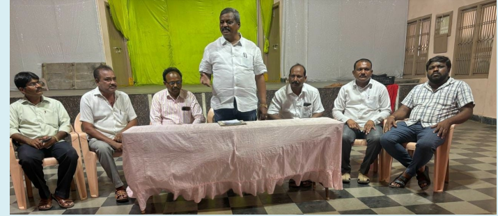
నర్సంపేట, మే 05 (పీపుల్స్ మోటివేషన్):-