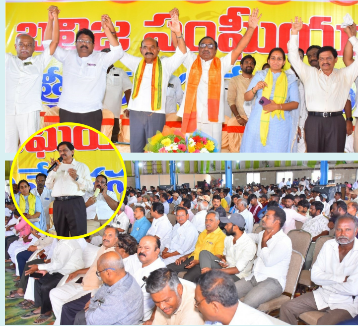
సంద్యాల, మే 05 (పేపుల్ మోటివేషన్):-

బలిజల సంక్షేమం కోసం కృషి చేస్తాం: ఎన్ఎండి ఫరూక్