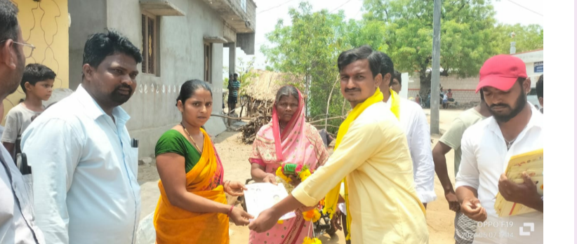
అలూరు, మే 07 (పేపుల్స్ మోటివేషన్):-