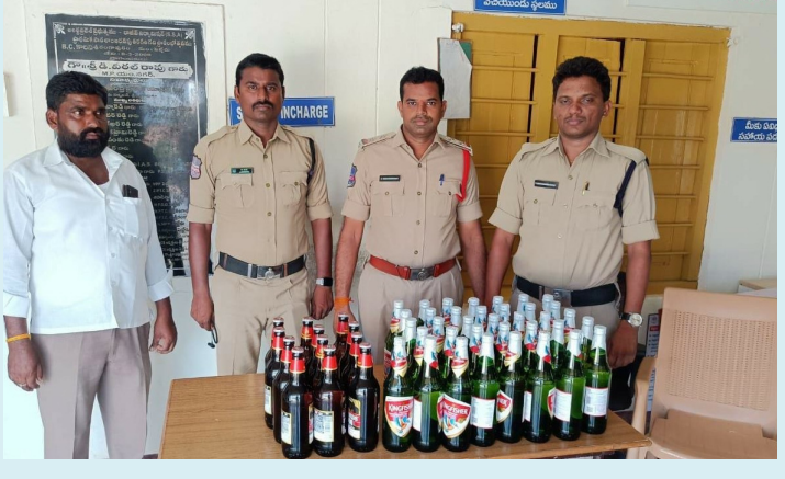
శ్రీరంగాపూర్/ వనపర్తి, మే 10 (పీపుల్స్ మోటివేషన్):-