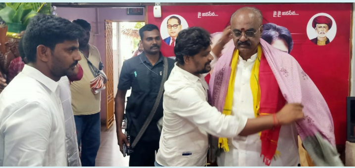
నరసాపురం, మే 10 (పీపుల్స్ మోటివేషన్):-