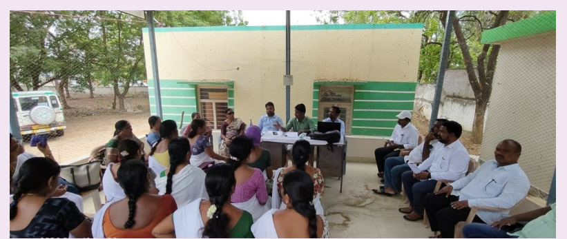
పెబ్బేరు, మే 20 (పేపుల్ మోటివేషన్):-