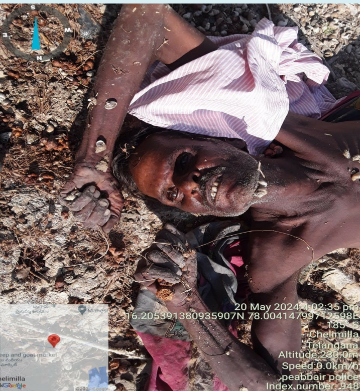
పెబ్బేరు, మే 20 (పేపుల్ మోటివేషన్):-

పెబ్బేరు విజెపి కాలువలో గుర్తుతెలియని శవం లభ్యం