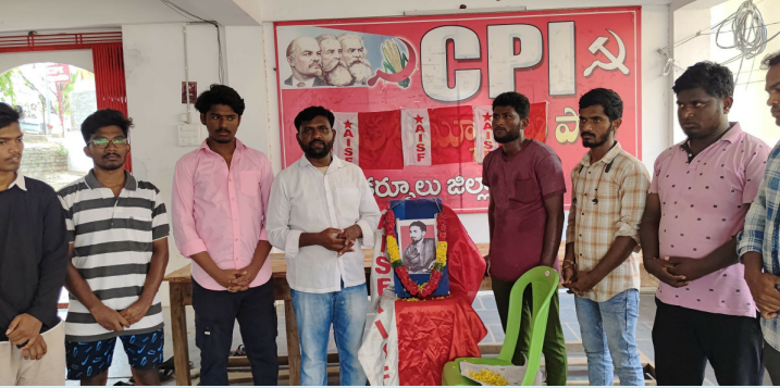
కర్నూలు, మే 20 (పేపుల్ మోటివేషన్):-