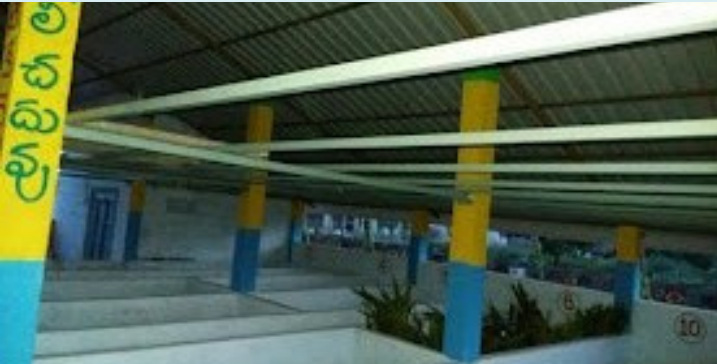
మిడుతూరు, మే 20 (పేపుల్ మోటివేషన్):-

నిరుపయోగంగా ఉన్న చెత్త నుంచి సంపద తయారీ కేంద్రం