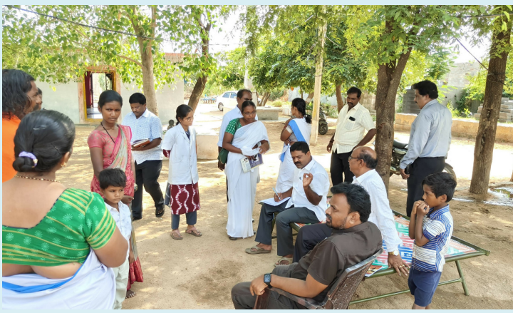
దేవనకొండ, మే 22 (పీపుల్స్ మోటివేషన్):-

ఈరోజు రాష్ట్ర కీటక జనత వ్యాధుల నియంత్రణ ఆఫీసర్లు డెంగ్యూ వ్యాధుల వెరిఫికేషన్ లో భాగంగా గతంలో కలివేముల గ్రామం లోపచ్చిన డెంగ్యూ కేసులను సందర్శించివాటికి జరిగిన అంటి లార్వా ఆపరేషన్లు పరిశీలించడం జరిగినది అదేవిధంగా గ్రామంలో లార్వా డెన్సిటీ ఎక్సైజన్ అందేమో అని గ్రామంలో చాలాచోట్ల పరిశీలించడం జరిగినది ఈ సందర్భంగా వైద్య సిబ్బందికి వారు కొన్ని సూచనలు చేయడం జరిగినది ప్రతి డ్రైడే ను ఖచ్చితముగా గ్రామంలో ఇంటింటికి తిరిగి చేయాలని లార్వా ఉంటే వాటిని వెంటనే తొలగించాలని అలాగే జ్వరం కేసులు ఉంటే రక్త పూత నమూనాలు తీసి ల్యాబ్ కు పంపాలని ఆయన కోరారు అదేవిధంగా డెంగ్యూ కేసులను వచ్చిన ఏరియాలో నాలుగు వారాలు కచ్చితంగా అంటి లార్వా ఆపరేషన్ జరగాలని జరగాలని ఆయన తెలియజేశారు.