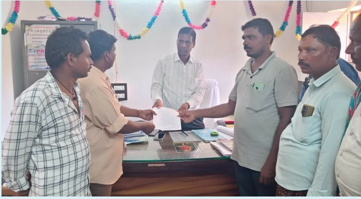
దేవనకొండ, మే 22 (పీపుల్స్ మోటివేషన్):-