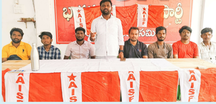
నందికొట్కూరు, మే 25 (పీపుల్స్ మోటివేషన్):-