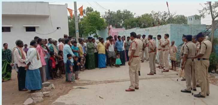
పత్రికాంధ, మే 25 (పీపుల్స్ మోటివేషన్):-