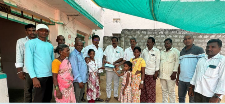
పెళ్ళేరు, మే 27 (పీపుల్స్ మోటివేషన్):-

లక్షలరూపాయల చెక్కును అందించిన, సింగిల్ విండో పాలకవర్గం