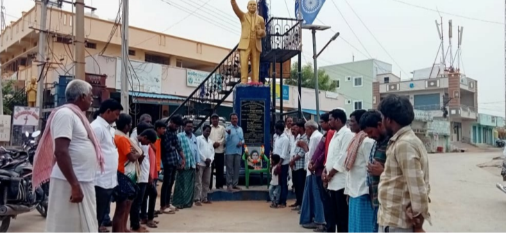
శ్రీరంగాపూర్ /వనపర్తి, మే 27 (పీపుల్స్ మోటివేషన్):-

శ్రీరంగాపూర్ మండల కేంద్రంలో అంబేద్కర్ యువజన సంఘం ఆధ్వర్యంలో ఘనంగా నిర్వహించారు భారత రాజ్యాంగ నిర్మాత దాక్టర్ బాబాసాహెబ్ అంబేద్కర్ గారి సతీమణి రమాబాయి గారి 89 వర్ణంతి వేడుకలు అంబేద్కర్ స్టాచు దగ్గర నిర్వహించారు ఇట్టి కార్యక్రమంలో అంబేద్కర్ యువజన సంఘ సభ్యులు మరియు ఉద్యోగులను గ్రామ పెద్దలు యువకులు చిన్నారులు ఇతరులు పాల్గొన్నారు.