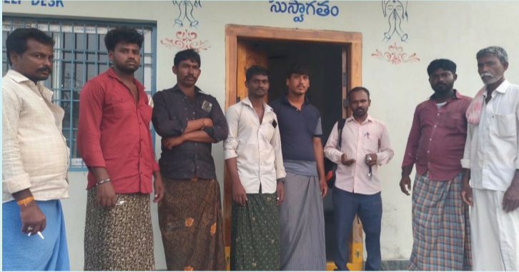
దేవనకొండ, మే 27 (పీపుల్స్ మోటివేషన్):-