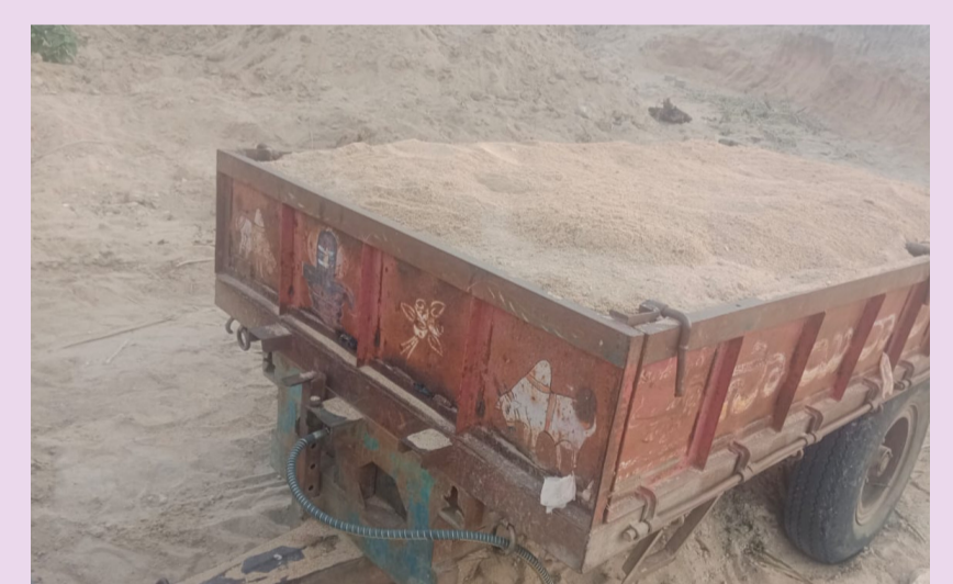
శ్రీరంగాపూర్ /పనపర్తి,మే 27 (పీపుల్స్ మోటివేషన్):-

శ్రీరంగాపూర్ మండల కేంద్రంలోని పాత సగరాల గ్రామంలో మధ్యాహ్నం 1:00 సమయంలో వారు నుంచి అక్రమంగా ఇసుక తరలిస్తున్న నాలుగు ట్రాక్టర్లను పట్టుకొని కేసు నమోదు చేసినట్లు ఎస్ ఐ వెంకటేశ్వర్లు ఓ ప్రకటనలో తెలియజేశారు.