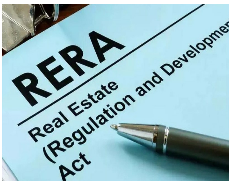
అందుబాటులో ఉంటాయని వెల్లడించారు. బాధ్యతగా పరిశీలించుకుని మోసాలకు గురికాకుండా కొనుగోలు చేసుకోవాలని రెరా స్పష్టం చేసింది.

రెరా నిబంధనలు ఉల్లంఘించిన పలు రియల్ ఎస్టేట్ కంపెనీలకు షోకాజు నోటీసులు జారీ చేశారు. ఆరు కంపెనీలు రెరా అనుమతులు లేకుండా అక్రమాలకు పాల్పడుతున్నట్లుగా గుర్తించారు. మియాపూర్ ప్రజ్ఞ ఎకోస్పెస్, చింతల్కుంట శ్రీ సిద్ధి వినాయక ప్రాజెక్ట్ డెవలపర్స్, కొండాపూర్ నార్త్ ఈస్ట్ హబిటీషన్స్, సంగారెడ్డి జిల్లా ఎ.ఆర్. ప్రమాటర్స్ అండ్ డెవలపర్స్, కెపిహెచ్బీ కాలనీ ఇన్వెస్టు ఇన్ ప్రా ప్రాజెక్టు, కొంపల్లి భారతి లేకూర్ టవర్ బిల్డింగ్స్ రెరా నిబంధనలు ఉల్లంఘించినందున 15 రోజుల లోగా సంజాయిషి సమర్పించాలని ఆదేశిస్తూ షోకాజు నోటీసులు జారీ చేసినట్లు రెరా అధికారి పేర్కొంది. రియల్ ఎస్టేట్ కంపెనీలకు జీహెచ్ఎంసీ, హెచ్ఎంసీ, డిటీసీ, యూడిఏ, టీజీఐసీ, ఇతర స్థానిక సంస్థల అనుమతులతో పాటు రెరా రిజిస్ట్రేషన్ ఉంటేనే కొనుగోలుదారులకు భద్రత, భరోసా చేకూరుతుందని రెరా తెలిపింది. ఇల్లు, ఫ్లాట్ కొనాలి అనుకునే వారు రెరా రిజిస్ట్రేషన్ ప్రాజెక్టులో మాత్రమే కొనుగోలు చేయాలని రెరా అధికారి కొనుగోలు దారులకు సూచించింది. డ్రీరాంట్ ఆఫర్లను సమ్మి రెరా రిజిస్ట్రేషన్ లేని ప్రాజెక్టులలో కొని మోసపోరాదని రెరా అధికారి విజ్ఞప్తి చేసింది. రెరా రిజిస్ట్రేషన్ పొందకుండా, జీహెచ్ఎంసీ, హెచ్ఎంసీ, డిటీసీ, యూడిఏ, టీజీఐసీ, ఇతర స్థానిక సంస్థల అనుమతులు లేకుండా వ్యాపార ప్రకటనలు జారీచేయడం, మార్కెటింగ్కు పాల్పడటం రెరా చట్ట రీత్యా నేరమని అధికారి స్పష్టం చేసింది. కొనుగోలు చేసే ముందు ఆయా ప్రాజెక్టులు, కంపెనీల నేపథ్యం తెలుసుకునే ప్రయత్నం చేయాలని సూచించారు. రెరా అనుమతి పొందనివి, ఆయా ప్రాజెక్టుల పూర్తి వివరాలు, ప్రమాటర్ పేరు, చిరునామా, ఇతర అన్ని వివరాలు రెరా వెబ్ సైటులో