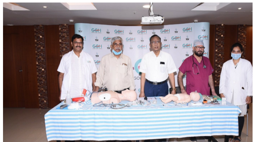
కర్నూలు, మే 27 (పీపుల్స్ మోటివేషన్):-

అత్యవసర పరిస్థితుల్లో మనిషి ప్రాణాలు కాపాడేందుకు సీపీఆర్ చేసే విధానంపై ప్రతి ఒక్కరికీ కనీస అవగాహన ఉండాలని కర్నూలు నగరంలోని ప్రముఖ గౌరవోపాల్ హాస్పిటల్ వైద్యులు చెప్పారు. అంతర్జాతీయ అత్యవసర చికిత్స దినోత్సవం సందర్భంగా గౌరవోపాల్ హాస్పిటల్ లో సీపీఆర్ పై అనుపత్తి సిబ్బందికి అవగాహన కార్యక్రమం నిర్వహించారు. సీపీఆర్ ఏ విధంగా చేసి పేషెంట్ ప్రాణాలు కాపాడగలగాలో వివరించారు. అనంతరం వైద్యులు మాట్లాడుతూ గుండెజబ్బులు వయస్సుతో నిమిత్తం లేకుండా వస్తున్నాయన్నారు.