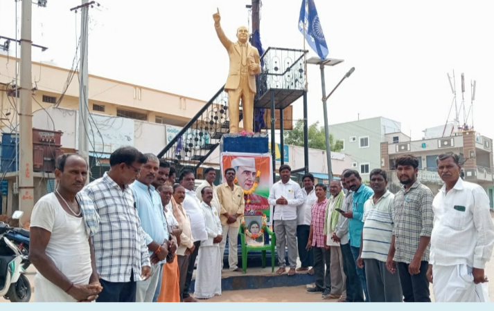
శ్రీరంగాపూర్/ వనపర్తి, మే 27 (పీపుల్స్ మోటివేషన్):-

● భారత రాజ్యాంగ నిర్మాత డాక్టర్ బాబాసాహెబ్ అంబేద్కర్ సతీమణి రమాబాయి 89 వర్ధంతి