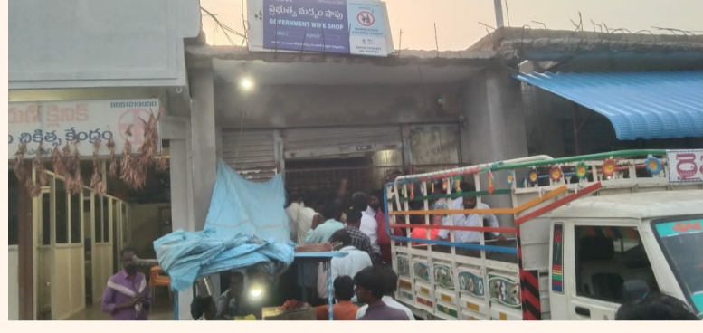
ఫోన్ పే చేస్తేనే మద్యం! -

ప్రభుత్వం వైన్ షాపులు వద్ద మందుబాబులు గగ్గోలు పెడుతున్నారు. ఇన్ఫాక్ట్ డబ్బులు ఇస్తేనే మద్యం విక్రయించే విధానానికి ప్రభుత్వం చరమగీతం పలికింది. తాజాగా ఫోన్ చేస్తేనే మద్యం ఇస్తామని వైన్ షాపు నిర్వాహకులు చెప్పడంతో మందుబాబుల్లో గందరగోళం ఏర్పడింది. చాలామంది మందుబాబులకు స్కాన్ చేస్తేనే వాటిల్లో ఫోన్ చేస్తేనే సాకర్లు లేదు. దీంతో వారికి ప్రభుత్వం మద్యం దుకాణాల్లో మందు దొరకని పరిస్థితి ఏర్పడింది. ఎప్పటిలాగానే తాము డబ్బులు ఇస్తేనే మద్యం ఇవ్వకపోవడంతో వైన్ షాపుల్లోని సిబ్బందితో మందుబాబులు వాగ్వివాదానికి దిగుతున్నారు. సాయంకాలం పని పూర్తి చేసుకుని, శరీర కష్టం నుంచి ఉపశమనానికి మద్యం తాగే అలవాటును వారంతా, కార్నర్ మందు కోసం క్యూలైన్లో నిలబడితే, లేనిపోని నిబంధనలు పెట్టి మందు లేదనేసరికి వారంతా చిర్రెత్తిపోతున్నారు. ఫోన్ చేస్తేనే మద్యం బాటిల్ పట్టు అంటూ ప్రభుత్వం వారి మద్యం దుకాణాల్లో విధానాన్ని మద్యం దుకాణాలు సిబ్బంది చెప్పేసరికి మొదట్లో ఖంగుతున్న మందుబాబులు, తర్వాత ఎక్కడలేని కోపాన్ని తెచ్చి చిందులేస్తున్నారు. అయితే తామేమీ చేయలేమని, ఉన్నతాధికారుల నుంచి వచ్చిన ఆదేశాల మేరకు ఫోన్ చేస్తేనే మందు ఇస్తామని లేకుంటే లేదని చేతులెత్తేయడంతో వైన్ షాపుల దగ్గర మందుబాబులు గగ్గోలు పెట్టారు. మద్యం అలవాటు ఉండి, ఫోన్ సదుపాయం లేని వారంతా ఏం చేయాలో తెలియక తలలు పట్టుకున్నారు. మొత్తానికి కొత్తగా అమల్లోకి వచ్చిన మద్యం అమ్మకాల విధానంతో మందుబాబులకు ఏం చేయాలో పాలుపోని పరిస్థితి ఉంది.