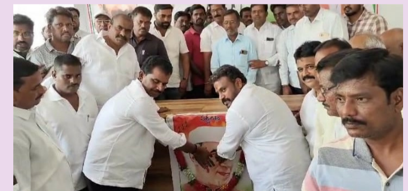
వనపర్తి బ్యారో, మే 27 (పీపుల్స్ మోటివేషన్):-