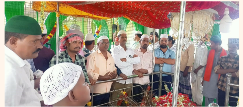
పత్తికొండ, జూన్ 19 (పీపుల్స్ మోటివేషన్):-

పత్తికొండ పట్టణంలోని చక్రాల రోడ్డులో వెలిసిన హజరత్ ఫక్కుమియా వలి స్వాముల 374 వ ఉరుసు ఉత్సవాలు బుధవారం జియరత్ ఫాతిహాల్తో ఘనంగా ముగిసాయిని దర్గా నిర్వాహకులు తెలిపారు. బుధవారం స్వామివారి సన్నిధిలో భక్తిశ్రద్ధలతో జియరత్ ఫాతిహాల్ నిర్వహించామన్నారు. అనంతరం భక్తులకు దర్గా ప్రాంగణంలో అన్నదాన కార్యక్రమాలను ఏర్పాటు చేశామన్నారు.