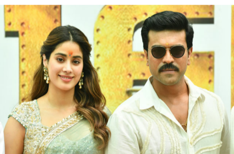
విడుదలకు ముందే చెబుతున్నాను ఇది సూపర్ హిట్ అవుతుంది. కథను అద్భుతంగా రాశారు' అని అన్నారు.

రామ్ చరణ్ హీరోగా బుచ్చిబాబు దర్శకత్వంలో ఓ సినిమా రానున్న సంగతి తెలిసింది. 'అరేసి16'గా ఇది ప్రచారంలో ఉంది. అధికారికంగా ఈ ప్రాజెక్టును ప్రకటించి చాలా రోజులైంది. ప్రస్తుతం ప్రీ ప్రొడక్షన్ పనుల్లో బిజీగా ఉన్న ఈ చిత్రంపై దర్శకుడు తాజాగా ఓ అప్డేట్ ఇచ్చారు. హీరో విజయ్ సేతుపతి నటించిన 'మహారాజు' హిట్ టాక్ను సొంతం చేసుకున్న నేపథ్యంలో దర్శకుడు బుచ్చిబాబు ఆ చిత్రబృందాన్ని ఇంటర్వ్యూ చేశారు. ఈ సందర్భంగా 'అరేసి16' గురించి విజయ్ మాట్లాడుతూ సినిమా స్టోరీ ఎంతో బాగుందని బుచ్చిబాబును ప్రశంసించారు. 'నాకు ఈ స్టోరీ మొత్తం తెలుసు.