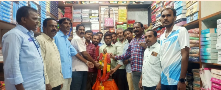
జేతంచెర్ల, జూన్ 19 (పీపుల్స్ మోటివేషన్):-