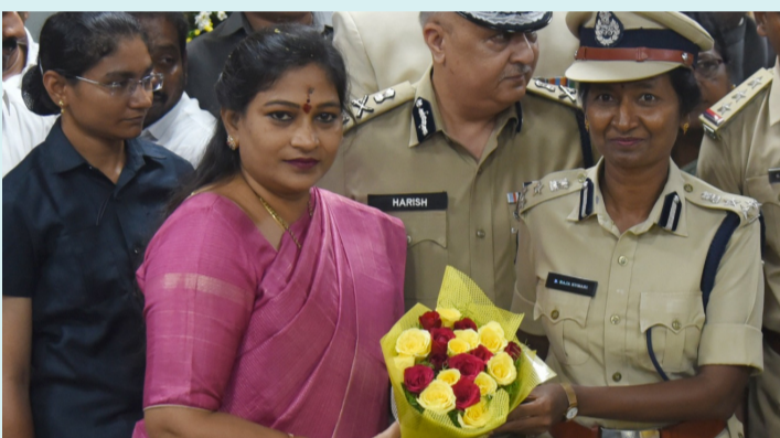
అమరావతి, జూన్ 19 (పీపుల్స్ మోటివేషన్) :