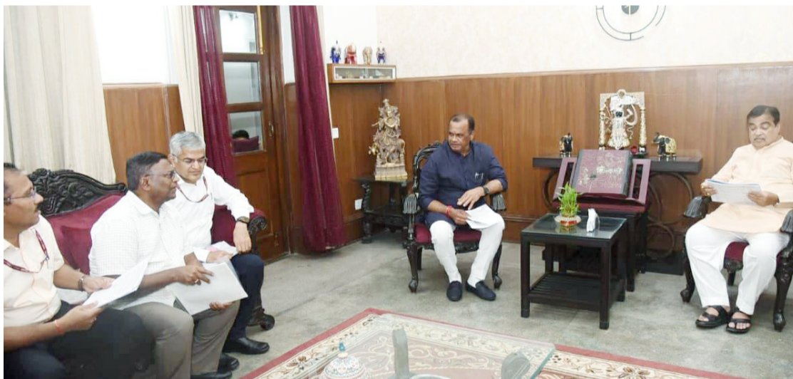
విజయవాడ 6 లైన్ల రహదారిని వెంటనే చేపట్టాలి ఉప్పల్ పై ఓవర్ పనులు త్వరగా పూర్తి చేయాలి కేంద్రమంత్రి నితిన్ గద్కర్ తో చర్చించిన మంత్రి కోమటిరెడ్డి

న్యూఢిల్లీ, జూన్ 24 (పీపుల్స్ మోటివేషన్):