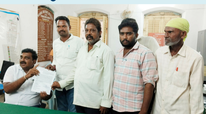
నందికొట్కూరు, జూన్ 24 (పీపుల్స్ మోటివేషన్):-