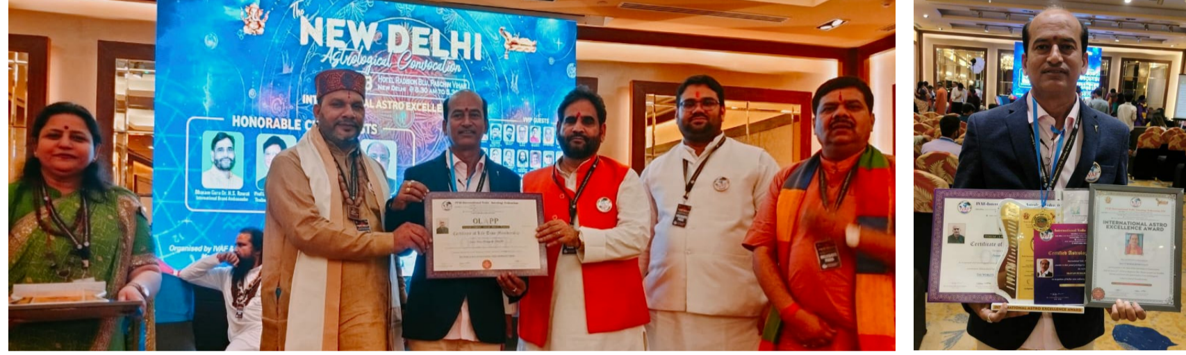
వేద జ్యోతిషంలో పరిశీలనకు దక్షిణ గుర్తింపు