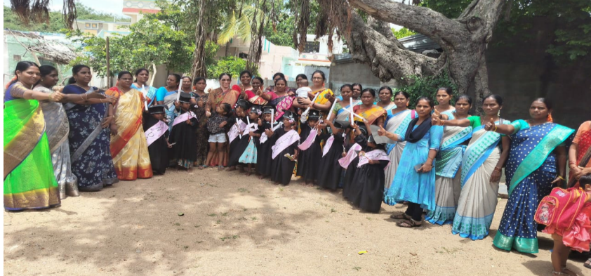
అంగన్వాడి టీచర్లు పాల్గొనడం జరిగింది.