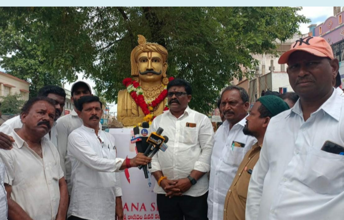
అళ్లగడ్డ, జూన్ 24 (పీపుల్స్ మోటివేషన్):-