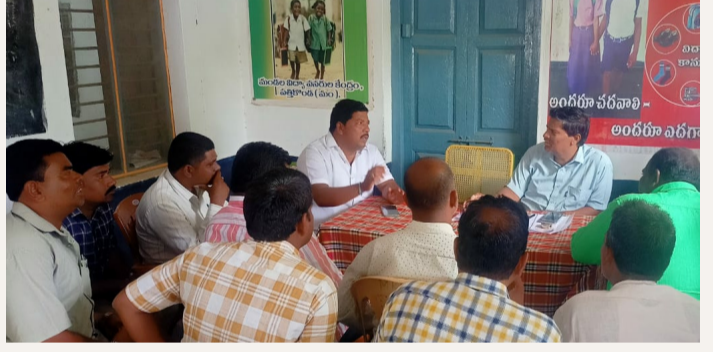
పత్తికొండ, జూన్ 24 (పేపుల్ మోటివేషన్):-