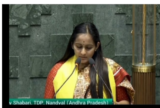
రాష్ట్రాలకు గవర్నర్ గా, ఎన్నో ఉన్నత పదవులు చేపట్టి సిల్వర్ జూబ్లీ పార్లమెంటరియన్ గా గుర్తింపు పొందిన పెండెకంటి వెంకటసుబ్బయ్య నంద్యాల ఎంపీ గా దేశానికి సేవలందించారు.

సోమవారం న్యూ ఢిల్లీలోని కొత్త పార్లమెంట్ భవనంలో 18 వ లోక్ సభకు ఎన్నికైన ఎంపీ లతో ప్రాటించి స్పీకర్ భర్తూ పారి ప్రమాణ స్వీకారం చేయించారు. నంద్యాల లోక్ సభ నుంచి ఎన్నికైన డాక్టర్. బైరెడ్డి శబరి ఆ ఈశ్వరుడు సాక్షిగా తెలుగులో ప్రమాణ స్వీకారం చేశారు. దేశ చిత్రపటంలో నంద్యాల లోక్ సభ నియోజకవర్గానికి విశిష్ట స్థానం, ప్రత్యేక గుర్తింపు ఉంది. భారత రాజ్యాంగంలోనే కీలక పదవులైన రాష్ట్రపతి, ప్రధానమంత్రి పదవులు చేపట్టి దేశానికి సేవ చేసిన నంద్యాల లోక్ సభ సభ్యులు నీలం సంజీవరెడ్డి, పీవీ నరసింహారావులు. ఐదు సార్లు నంద్యాల లోక్ సభకు ఎంపికై కేంద్రమంత్రిగా, కర్ణాటక, ఒరిస్సా