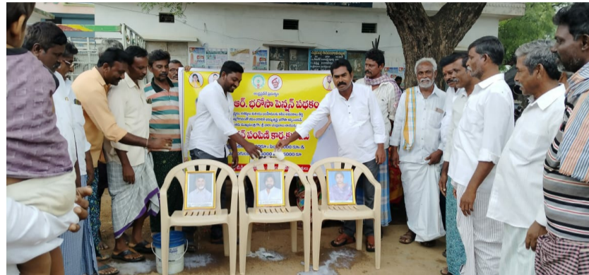
రుద్రవరం, జూలై 01 (పీపుల్స్ మోటివేషన్) :

రుద్రవరం మండలం చిత్రనిపల్లి గ్రామంలో సీఎం నారా చంద్రబాబు నాయుడు, డిప్యూటీ సీఎం పవన్ కళ్యాణ్, అక్షగడ్డ నియోజకవర్గం ఎమ్మెల్యే భూమా అభిలప్రియ చిత్రపటాలకు పాలాభిషేకం చేసిన పెన్షన్ లబ్ధిదారులు మరియు జనసేన, టిడిపి నాయకులు. ఎన్టీఆర్ భరోసా