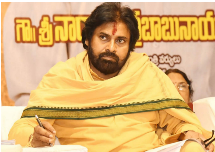
పితామహం, జూలై 1 (పీపుల్స్ మోటివేషన్):

ఆఖరిశ్వాస వరకు ప్రజల కోసమే పనిచేస్తూ చంద్రబాబు అనుభవమే రాష్ట్రానికి శ్రీరామరక్ష గ్రామాల్లో మంచినీటి సమస్యను పరిష్కరిస్తూ పితామహుని అంతర్జాతీయ గుర్తింపు వచ్చాకే ఊరేగించండి జనసేన వీరమహిళలతో ఆత్మీయ సమావేశంలో పవన్ కళ్యాణ్