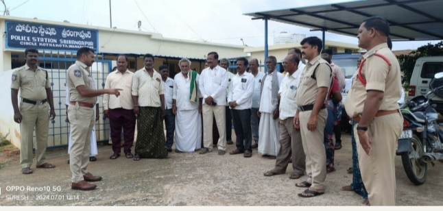
శ్రీరంగాపూర్ /పనపర్తి, జూలై 01 (పీపుల్స్ మోటివేషన్):-