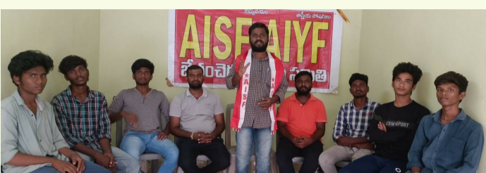
వేతంపర్తి, జూలై 02 (పీపుల్స్ మోటివేషన్):-