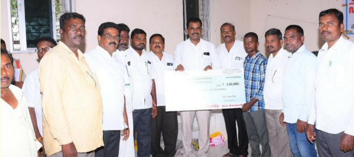
పెద్దేరు, జూలై 02 (పీపుల్స్ మోటివేషన్):-