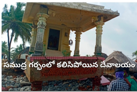
సముద్ర గర్భంలో కలిసిపోయిన దేవాలయం

వణికిపోతుంటాయి. దశాబ్దాలకాలంగా సముద్రపు కోతతో అత్యంత విలువైన వందల ఎకరాల భూములు సముద్ర గర్భంలో కరిగిపోతుండగా కోట్లాది రూపాయల విలువైన ఇళ్లు, ఆస్తులు సముద్రపు కెరటాల తాకిడికి కొట్టుకుపోతున్నాయి. తెలుగుదేశం ప్రభుత్వం హయాంలో ప్రతిపక్షనేత హెడాలో ప్రజాసంకల్పయాత్రలో తీరప్రాంత ప్రజలకు సముద్రం ముందుకు రాకుండా జియో ట్యూబ్ నిర్మాణానికి హామీ ఇచ్చి అసెంబ్లీ సాక్షిగా 30 కోట్ల రూపాయలు కేటాయించి నా వైసిపి ప్రభుత్వం దానిని అమలు చేయలేదు. గత ప్రభుత్వంలో సముద్రపు కోత సమస్యను పరిష్కరించాలని కేంద్ర ప్రభుత్వానికి విన్నవించారు. దాంతో కేంద్రం నుండి వచ్చిన బృందం తీరప్రాంతాన్ని పరిశీలించారు అయినప్పటికీ ఎటువంటి చర్యలు చేపట్టలేదు. మొన్న కొత్తగా వచ్చిన ఎన్డీఎ ప్రభుత్వం పిఠాపురం ఎమ్మెల్యే ఉపమఖ్యమంత్రి పవన్ కళ్యాణ్ తీర ప్రాంతాన్ని పరిశీలించి సముద్రం ముందుకు రాకుండా చర్యలు చేపడతామని తెలిపారు.