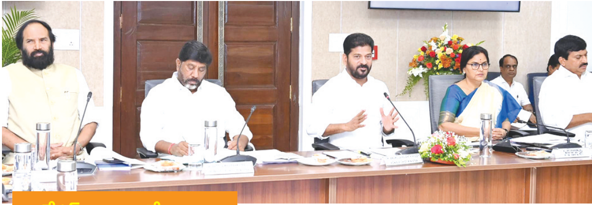
హైదరాబాద్, జూలై 17 (పేపుల్స్ మోటివేషన్) :

రైతు రుణమాఫీ అమలుకు సంబంధించి తెలంగాణ ముఖ్యమంత్రి రేవంత్ రెడ్డి కాంగ్రెస్ కార్యకర్తలకు కీలక సూచన చేశారు. గతంలో కాంగ్రెస్ సర్కార్ ఇచ్చిన ఉచిత కరెంటు, ఆరోగ్య శ్రీ, ఇందిరమ్మ ఇండ్ల గురించి ఇప్పటికీ చెప్పుకుంటూ ఉన్నామని గుర్తుచేశారు. రేపు రైతు రుణమాఫీ గురించి 20 సంవత్సరాలు చెప్పుకోవాలని ఆయన కాంగ్రెస్ కార్యకర్తలకు పిలుపునిచ్చారు. రైతులు ఆత్మహత్య చేసుకోవద్దని చెప్పడానికే రూ. 2 లక్షల రుణ మాఫీని అమలు చేస్తున్నామని వివరించారు. గురువారం సాయంత్రం 4 గంటలకు తాను వీడియో కాన్ఫరెన్స్ ద్వారా రైతు వేదికలకు కనెక్ట్ అవుతానని చెప్పారు. రైతు వేదికలో రైతులంతా సమావేశం కావాలని, ఇది రాహుల్ గాంధీ చెప్పారని చెప్పడం కాంగ్రెస్ కేడర్లకు సీఎం రేవంత్