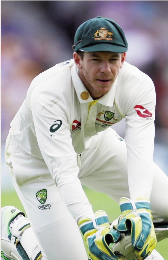
అసిన మాజీ కెప్టెన్ టీమ్ పైన్ వెల్డె