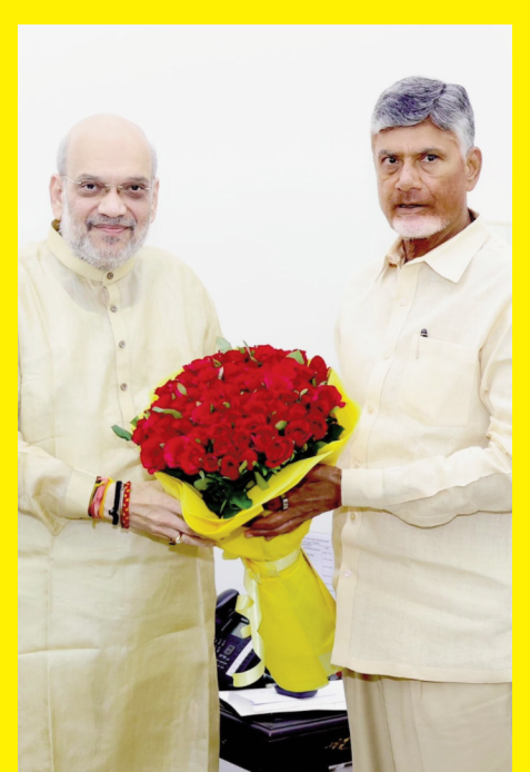
ఢిల్లీలో ముగిసిన చంద్రబాబు పర్యటన లుమినోతో మాత్రమే చర్చలు