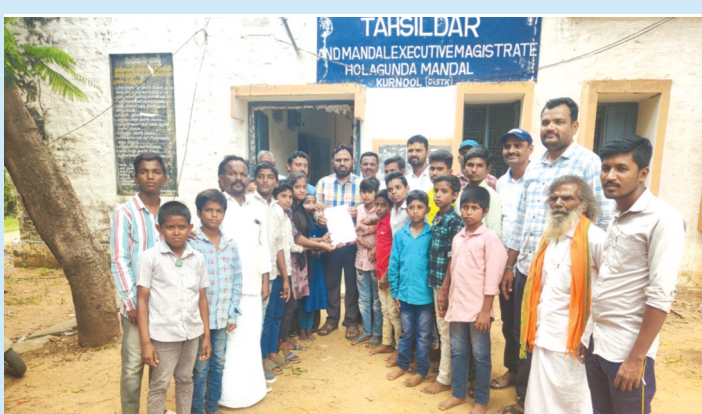
హెలగుండ/ కర్నూలు, జూలై 24 (పీపుల్స్ మోటివేషన్):-