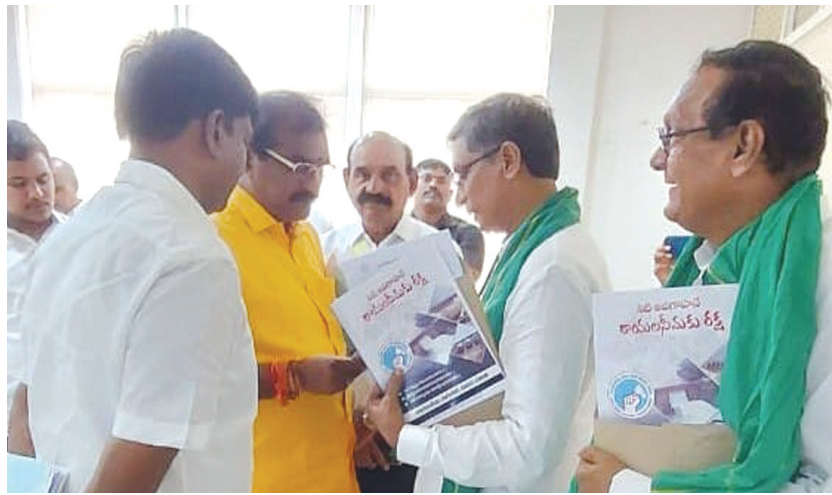
రాయలసీమ నీటి సమస్యల పరిష్కారానిపై సమగ్రమైన చర్యలు చేపడుతాం మంత్రి నిమ్మల రామానాయుడు