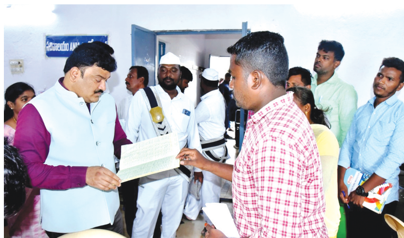
జిల్లా కలెక్టర్ పి.రంజిత్ బాపా