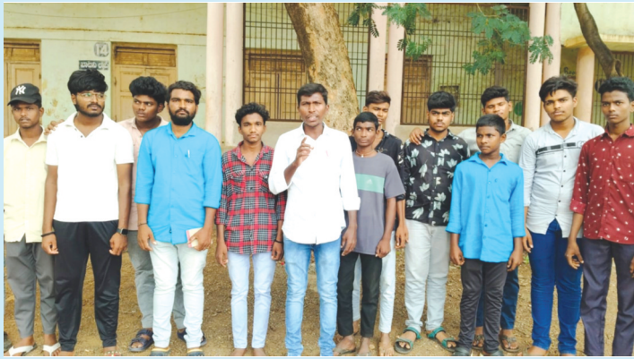
నందికొట్లూరు, జూలై 27 (పీపుల్స్ మోటివేషన్):-