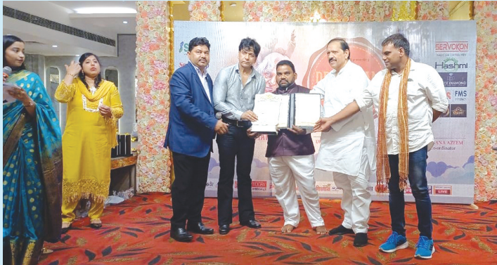
ఆస్పరి, జూలై 27 (పీపుల్స్ మోటివేషన్):-