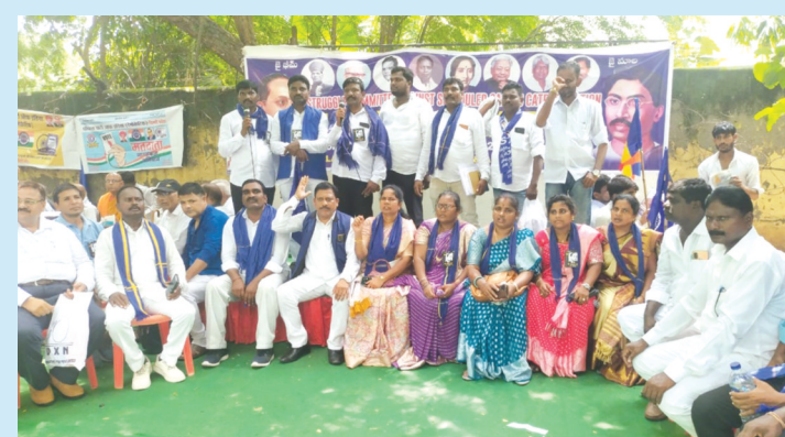
తెలుగు రాష్ట్రాల మాల మహానాడు సంఘాల జేపీసీ అధ్యక్షులలో ఢిల్లీలో జంతు మంతర్ వద్ద ధర్మా...

ప్రాజ్ఞులూరు, ఆగస్టు 10 (పేపుల్స్ మోటివేషన్):-