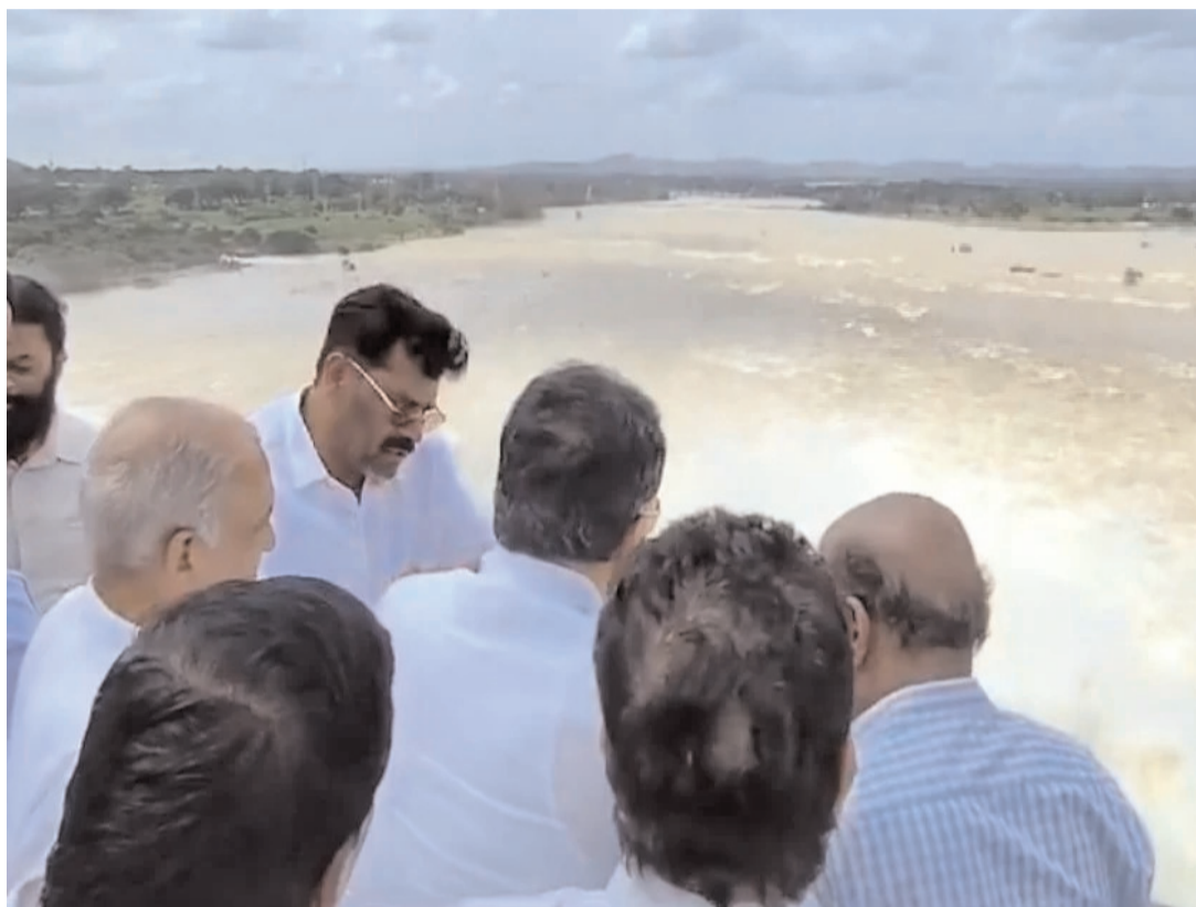
మరమ్మతులకు అవకాశం ఉంటుందన్నారు. వీలైనంత త్వరగా గేటును పునరుద్ధరిస్తామన్నారు. కాగా, గేటు మరమ్మతుల కోసం నీటిని కిందకు వదులుతున్నారు. మరో ఏడు గేట్ల డ్యామా నీటిని విడుదల చేస్తాన్నారు.

తుంగభద్ర డ్యామ్ గేటు కొట్టుకుపోయిన నేపథ్యంలో... ఈ ఏడాది ఖరీఫ్ పంటకు నీరు అందేలా చూస్తామని, రబీ పంటకు మాత్రం నీరు అందించడం కష్టమేనని... కాబట్టి రైతులు సహకరించాలని కర్ణాటక ఉపముఖ్యమంత్రి డీకే శివకుమార్ అన్నారు. తుంగభద్ర డ్యామ్ 19వ గేటు కొట్టుకుపోవడంతో ఆయన ఆదివారం డ్యాంను పరిశీలించారు. గేటు ధ్వంసం కావడానికి గల కారణాలను అధికారులను అడిగి తెలుసుకున్నారు. డ్యాంకు గేటును బిగించే అంశంపై మాట్లాడారు. అనంతరం ఆయన మాట్లాడుతూ... తుంగభద్ర డ్యామ్ 19వ గేటు ధ్వంసం కావడం బాధకరమన్నారు. ఈ డ్యామ్ కర్ణాటక- ఆంధ్రప్రదేశ్- తెలంగాణ మూడు రాష్ట్రాలకు వరప్రదాయిని అన్నారు. ఈ డ్యామ్లో 40 టీఎంసీల నీరు నిల్వ ఉందన్నారు. మిగతా నీటిని దిగువకు విడుదల చేస్తే గేటు