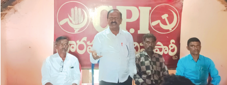
దేవనకొండ ఆగస్టు 12 (పీపుల్స్ మోటివేషన్):-