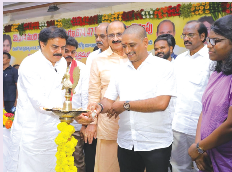
ఏలూరులో రైతులకు ధాన్యం బకాయిల చెక్కుల పంపిణీ రైతులకు రూ.1,674 కోట్ల ధాన్యం బకాయిలు పెట్టిన జగన్ ఇకనుంచి ధాన్యం కొనుగోళ్లు చేసిన 48 గంటల్లో చెల్లింపులు ఏలూరులో రైతులకు బకాయి చెక్కులు అందచేసిన మంత్రి నాదెండ్ల