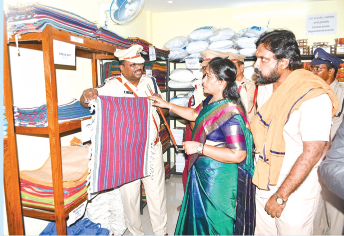
రాజమండ్రి, ఆగస్టు 12 (పీపుల్స్ మోటివేషన్):

ఆంధ్రప్రదేశ్ నిరుద్యోగులకు రాష్ట్ర హోంమంత్రి వంగలపూడి అనిత శుభవార్త చెప్పారు. త్వరలోనే పోలీస్ ఉద్యోగాలను భర్తీ చేయనున్నట్లు ప్రకటించారు. రాష్ట్రంలో పటిష్టమైన పోలీసు వ్యవస్థను ఏర్పాటు చేస్తామన్నారు. రాజమండ్రి పర్కల్ లో భాగంగా సోమవారం నాడు మీడియాతో మాట్లాడిన అనిత.. రాష్ట్రంలో శాంతి భద్రతలపై కీలక వ్యాఖ్యలు చేశారు. రాష్ట్రంలో మహిళలపై జరుగుతున్న అత్యాచారాలను అరికట్టేందుకు చర్యలు తీసుకుంటామన్నారు. గంజాయి నిర్మూలనపై ప్రత్యేక దృష్టి పెట్టామని, గంజాయి సాగు నుంచి గిరిజనులను దూరం చేసేందుకు కృషి చేస్తూ, గంజాయి లేని రాష్ట్రంగా మారుస్తామన్నారు. కొవ్వారు తనకు పుట్టింటి లాంటిదని.. కొవ్వారు పోలీస్ స్టేషన్ ను మోడ్రన్ పోలీస్ స్టేషన్ గా తీర్చిదిద్దామని చెప్పారు హోంమంత్రి. జైల్ బ్యాచ్ వంటి వాళ్లపై ప్రత్యేకంగా నిగా పెట్టామని హోంమంత్రి చెప్పారు. ఇదిలాఉంటే.. హోంమంత్రి ప్రకటనతో ఉద్యోగార్థుల్లో ఆశలు చిగురించాయి. ప్రస్తుతం రాష్ట్ర పోలీస్ డిపార్ట్ మెంట్ లో 19 వేలకు పైగా ఖాళీలు ఉన్నట్లు సమాచారం. ఇప్పటికే 6,100 పోస్టుల భర్తీ పత్రాలు ఖాళీ కేసుల కారణంగా నిలిచిపోయింది. వీటిని భర్తీ చేస్తారా? లేక కొత్త నోటిఫికేషన్ కూడా రిలీజ్ చేస్తారా? అనే సందేహం వ్యక్తమవుతోంది. మొత్తంగా చూస్తే రాష్ట్రం పోలీస్ శాఖలో సుమారు 22 వేల ఖాళీలు ఉన్నట్లు తెలుస్తోంది. ఇందులో కానిస్టేబుల్ పోస్టులే ఎక్కువగా ఉన్నాయి. మరి ఈ భర్తీ పత్రాలు ఎప్పుడు ప్రారంభిస్తారనేది తెలియదు. కాగా, రాష్ట్రంలో పోలీస్ ఉద్యోగాల భర్తీని ఆంధ్రప్రదేశ్ రాష్ట్ర పోలీస్ నియామక మండలి చేపడుతుంది.