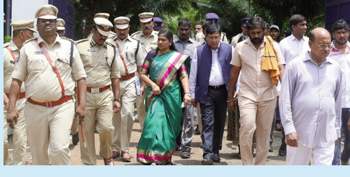
రాజమండ్రి, ఆగస్టు 12 (పీపుల్స్ మోటివేషన్):

గంజాయి నిర్మూలనకు కలిసేసిన ఆదేశాలు త్వరలోనే పోలీస్ ఉద్యోగాలను భర్తీ రాష్ట్ర హోంమంత్రి వంగలపూడి అనిత