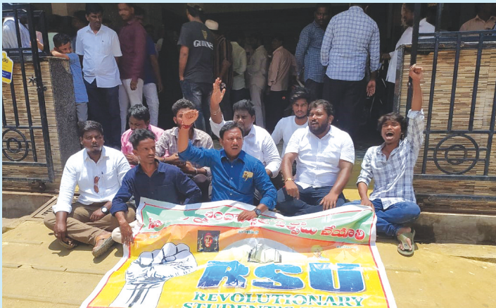
నంద్యాల, ఆగస్టు 12 (పీపుల్స్ మోటివేషన్):-

వేలకు వేల ఫీజులు వసూలు చేస్తున్న శాంతినికేతన్ విద్యాసంస్థలు సంకల్ప సూల్ గుర్తింపు రద్దు చేసేంతవరకు పాఠాటాలు కొనసాగిస్తాం