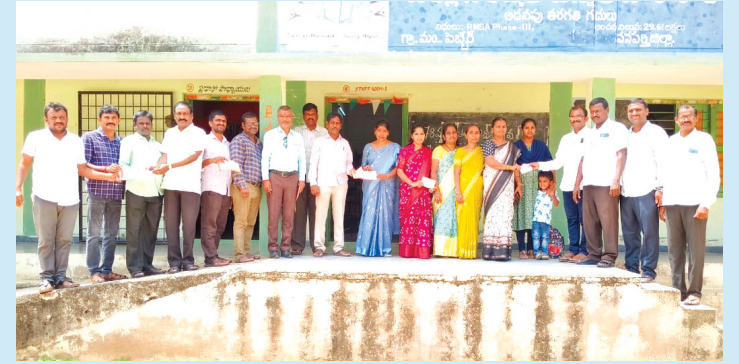
పెద్దేరు, ఆగస్టు 29 (షీపుల్స్ మోటివేషన్):