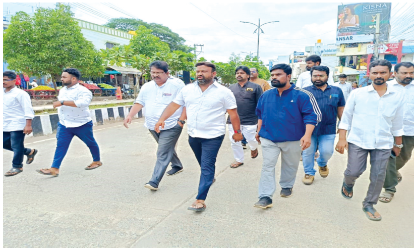
నంద్యాల, ఆగస్టు 29 (షీపుల్స్ మోటివేషన్):-