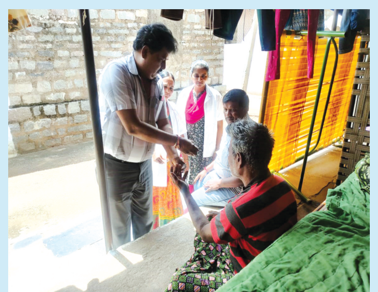
దేవనకొండ, ఆగస్టు 29 (షీపుల్స్ మోటివేషన్):-