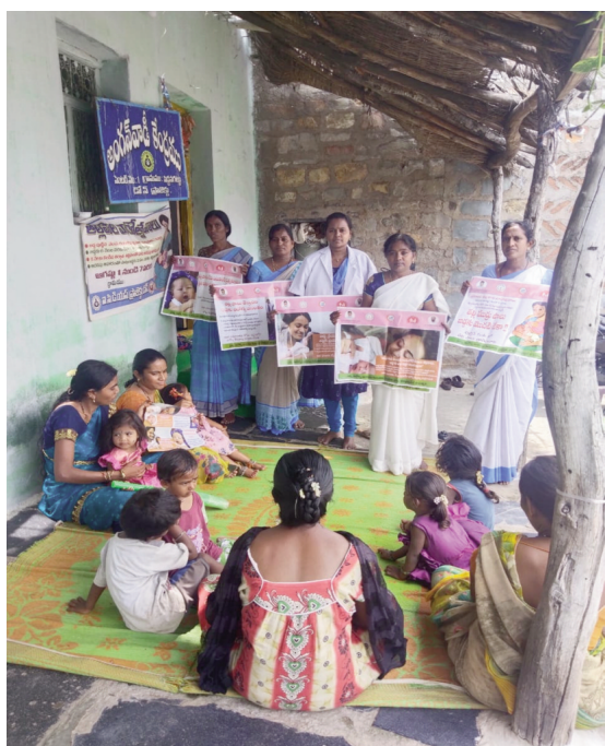
తల్లిపాల సంస్కృతిని ప్రోత్సహిస్తూ తల్లిపాల వారోత్సవాలలో అంగన్వాడీ కార్యకర్తలు, ఏఎన్ఎమ్లు

పాపిలి, ఆగస్టు 03 (పీపుల్స్ మోటివేషన్):-