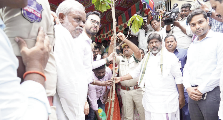
అమరావతి, ఆగస్టు 3 (పీపుల్స్ మోటివేషన్) :