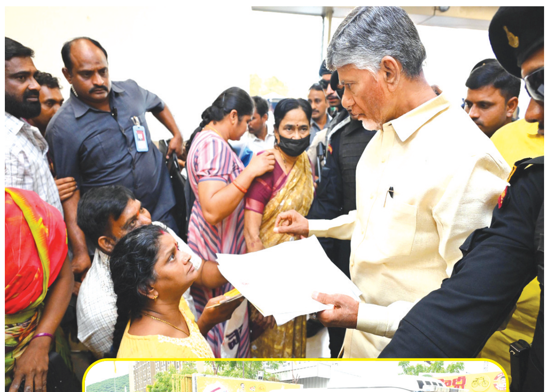
సమీక్షలు సత్ఫలితాలు ఇస్తున్నాయని చంద్రబాబు తెలిపారు.

అక్రమాలకు పాల్పడిన అధికారులను వదిలేది లేదని సీఎం చంద్రబాబు హెచ్చరించారు. పాలనను గాడిలో పెడుతున్నామని, అక్రమాలను వెలికి తీస్తున్నామని అన్నారు. అక్రమార్కులు ఎవరైనా వదిలి పెట్టోమని అన్నారు. మంగళగిరిలోని తెదేపా కేంద్ర కార్యాలయంలో ప్రజల నుంచి వివరాలు స్వీకరించిన అనంతరం ఆయన మీడియాతో మాట్లాడారు. వివరాలు అన్నింటినీ పరిష్కరించడమే తమ లక్ష్యమన్నారు. రెవెన్యూ సంబంధిత సమస్యలపైనే అధికంగా ఫిర్యాదులు వచ్చాయన్నారు. ఈ సమస్యలకు కారణమైన అధికారులపై చర్యలు తీసుకుంటామని స్పష్టం చేశారు. వైకాపా కారణంగా ప్రతి మండలంలోనూ ఓ భూకుంభకోణం వెలుగు చూస్తోందని తెలిపారు. రికార్డులను కూడా తారుమారు చేశారని చంద్రబాబు ఆరోపించారు. రీసర్వే అస్తవ్యస్తంగా జరగడం వల్లే ప్రజలకు ఇబ్బందులు వస్తున్నాయి. ప్రతి జిల్లాలో రెవెన్యూ సంబంధిత ఫిర్యాదుల స్వీకరణకు ప్రాధాన్యం ఇస్తాం. రెవెన్యూ శాఖను గత ప్రభుత్వంలో నిర్వీర్యం చేశారు. మదనపల్లె ఘటనే రెవెన్యూ శాఖ నిర్వీర్యునికీ ఉదాహరణ. వ్యవస్థలను 100 రోజుల్లో గాడిన పెడతాం. రెవెన్యూ శాఖను ప్రక్షాళన చేస్తాం. భూ కబ్జాదారులపై కఠిన చర్యలు తీసుకుంటాం. సమస్యలను విభాగాల వారీగా విభజించి పరిష్కరిస్తాం. వివరాలు ఇచ్చేందుకు అమరావతి రాకుండా ప్రత్యామ్నాయ ఏర్పాట్లు చేస్తాం. నియోజకవర్గాలు, జిల్లాల్లో ఫిర్యాదులు తీసుకునేలా ఏర్పాట్లు చేస్తాం. నా పర్యటనల వల్ల ఎవరూ ఇబ్బందిపడకుండా మార్పులు తెస్తాం. శాఖల వారీగా