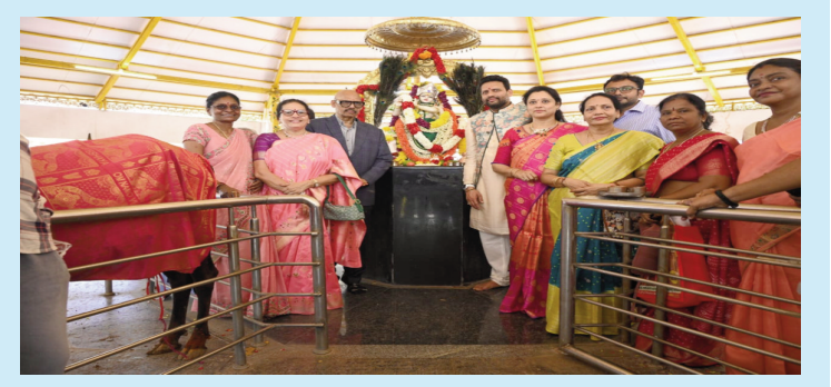
కర్నూలు, ఆగస్టు 05 (పీపుల్స్ మోటివేషన్):-