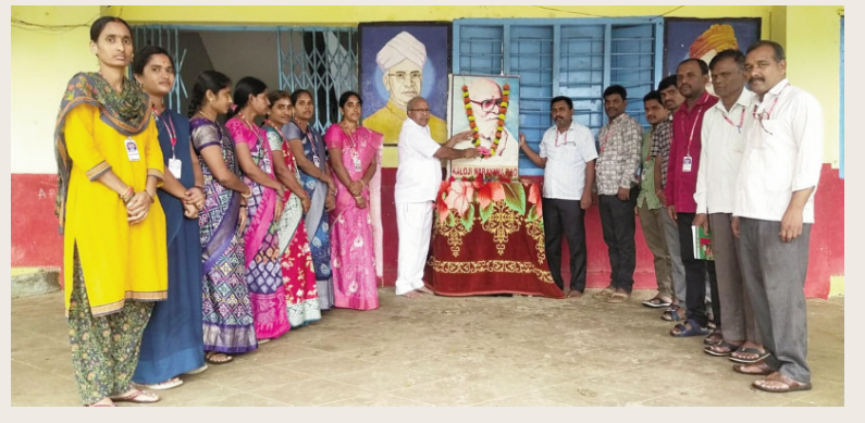
పీపుల్స్ మోటివేషన్, చెన్నారావుపేట:-