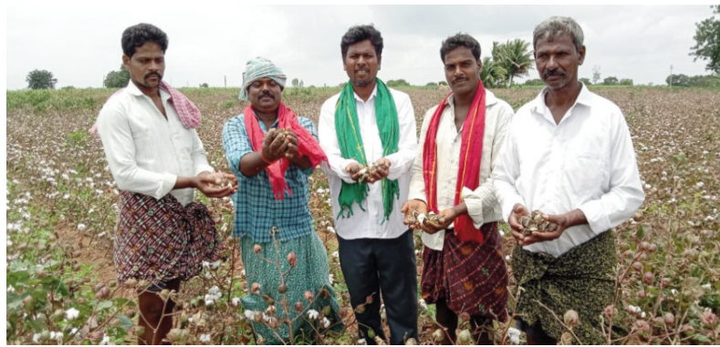
అలూరు, సెప్టెంబర్ 9 (పీపుల్స్ మోటివేషన్):-