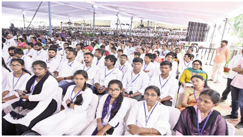
విద్యార్థులు ఇతర రాష్ట్రాల్లోకి వెళ్లకూడా వెనలబాటు ఇన్స్టిట్యూట్ కు కొండా లక్ష్మణ్ బాపూజీ పేరు నాంపల్లిలో ఐఐఐఐటీని వర్చువల్ గా ప్రారంభించిన సీఎం రేవంత్

హైదరాబాద్, సెప్టెంబర్ 9 (పీపుల్స్ మోటివేషన్):