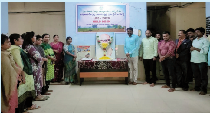
పీపుల్స్ మోటివేషన్, నర్సంపేట:-