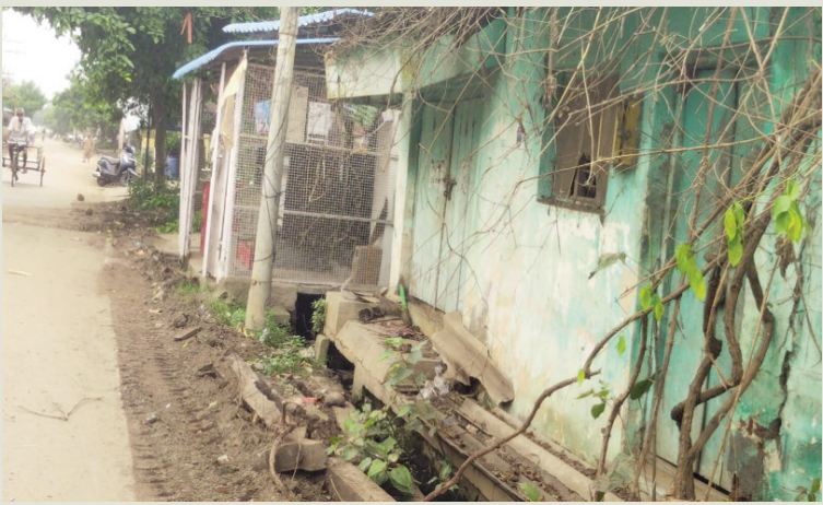
యు కొత్తపల్లి మండలం, సెప్టెంబర్ 9 (పీపుల్స్ మోటివేషన్):-

వాకతిప్ప గ్రామపంచాయతీ శెట్టిబలిజేపేట వద్ద డ్రైనేజీ పై అక్రమంగా బడ్డి కొట్టు నిర్మించారు. వాటిని తొలగించాలని ఈ మధ్యకాలంలో కొంతమంది ప్రజలు పంచాయతీ సెక్రటరీకి వినతి పత్రం ఇవ్వడం జరిగింది. వాటిపై త్వరలోనే నిర్ణయం తీసుకుంటామని సెక్రటరీ తెలిపినట్లు గ్రామ వాసులు తెలిపారు. అనంతరం వారు మాట్లాడుతూ ఈ అక్రమ కట్టడం వల్ల డ్రైనేజీ నుంచి నీరు వెళ్లక ఇబ్బంది పడుతున్నామని. వాటి ద్వారా రోగాలు వచ్చే అవకాశం ఉందని వారు వాపోయారు. ఈ బడ్డి కొట్టును తొలగించాలని లేనిచో పై అధికారుల దృష్టికి తీసుకుని వెళ్లమని వారు తెలిపారు.