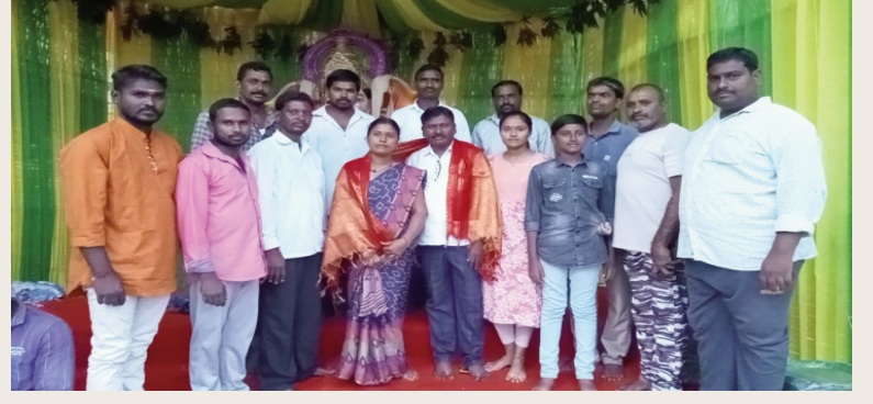
శ్రీరంగాపూర్/పనపర్తి, సెప్టెంబర్ 09 (పీపుల్స్ మోటివేషన్):-