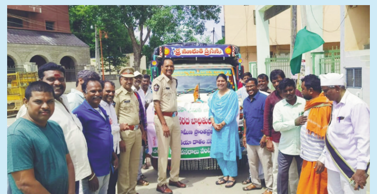
డోన్, సెప్టెంబర్ 9 (పీపుల్స్ మోటివేషన్):-