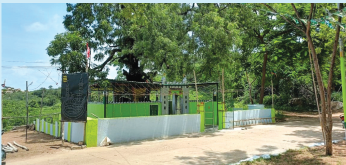
పత్రికాంధ, సెప్టెంబర్ 14 (పీపుల్స్ మోటివేషన్):-

పత్రికాంధ పట్టణంలోని వరమడిలో వెలసిన గురుదేవులు హజరత్ సయ్యద్ షా మొహమ్మద్ పీర్ మొహియుద్దీన్ స్వాముల వారి ఉరుసు ఉత్సవాలు సెప్టెంబర్ 16 నుంచి ప్రారంభం అవుతాయని దర్గా నిర్వాహకులు తెలిపారు. వారు తెలిపిన వివరాల మేరకు.. సెప్టెంబర్ 16వ తేదీన స్వామి వారి సన్నిధిలో గంధం కార్యక్రమం ఉంటుందని అన్నారు. సెప్టెంబర్ 17న ఉరుసు మహోత్సవం, 18న జియారత్ ఫాతిహాలు ఉంటాయని పేర్కొన్నారు. భక్తులకు ఎటువంటి ఇబ్బందులు కలగకుండా అన్ని ఏర్పాట్లు పూర్తి చేశామని తెలిపారు. ఉరుసు రోజున సాయంత్రం 6 గంటలకు భక్తులకు అన్నదాన కార్యక్రమం ఏర్పాటు చేశామన్నారు. భక్తులు పెద్ద ఎత్తున ఉరుసు కార్యక్రమాలలో పాల్గొనాలని హాస్పెస్ ఆలం కమిటీ వారు కోరారు.