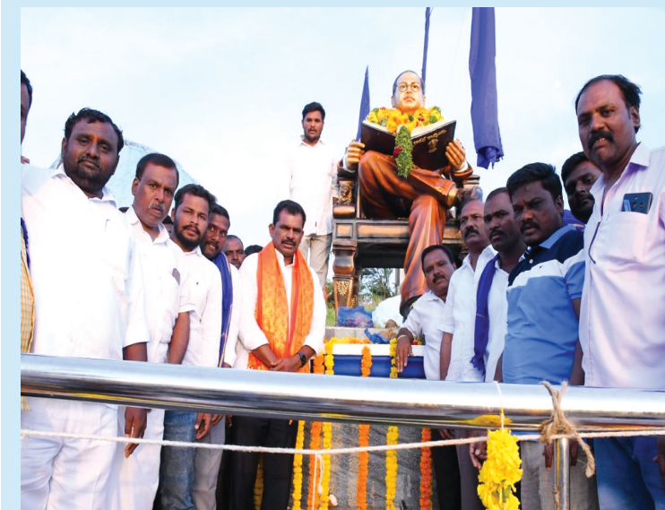
పెళ్ళేరు, సెప్టెంబర్ 14 (పీపుల్స్ మోటివేషన్):-