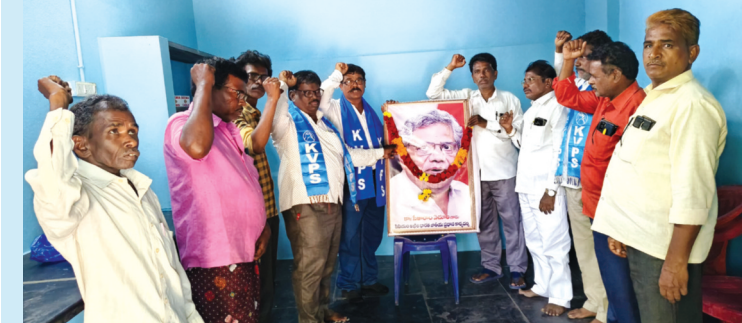
కర్నూలు, సెప్టెంబర్ 14 (పీపుల్స్ మోటివేషన్):-