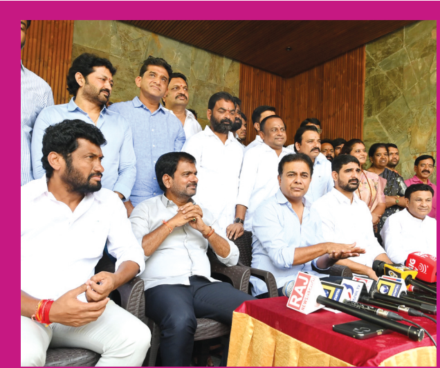
ఎంబీబీఎస్, బీడీఎస్ అడ్మిషన్ల ప్రక్రియకు బ్రేకులు ఇంకెంతకాలం ప్రతిభువంశం కొనసాగిస్తారు సాంత రాష్ట్ర విద్యార్థులను నాన్ లోకల్ చేస్తారా ప్రభుత్వానికి మాజీమంత్రి కెటిఆర్ సూటిప్రశ్న