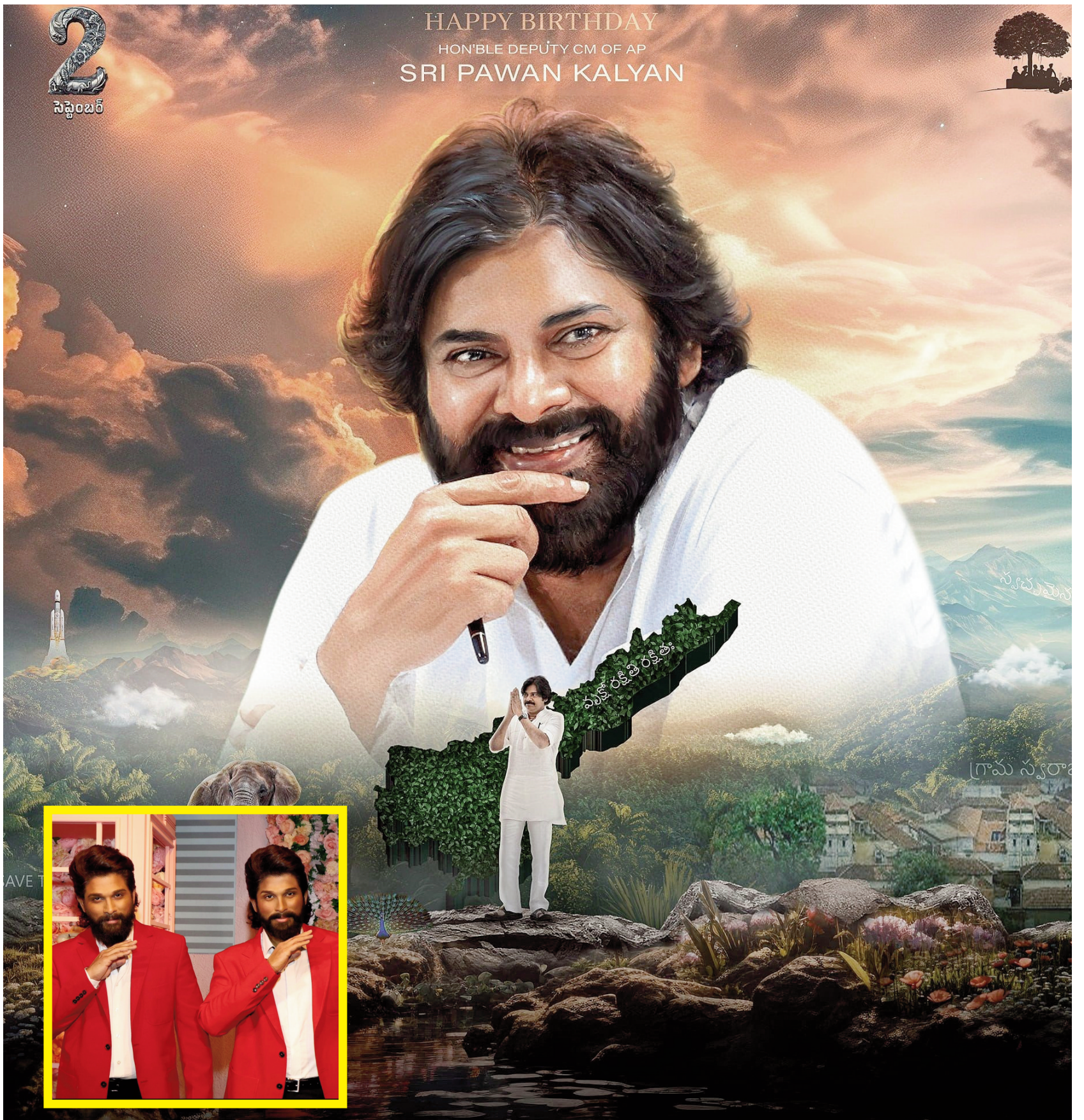
సినీ రాజకీయ ప్రముఖుల అభినందనలు డిప్యూటీ సీఎం అంటూ అల్లు అర్జున్ విషయం

నటుడు, ఆంధ్రప్రదేశ్ ఉప ముఖ్యమంత్రి పవన్ కళ్యాణ్ పుట్టినరోజు సందర్భంగా ఆయనకు సినీ, రాజకీయ ప్రముఖులు సోషల్ మీడియా వేదికగా శుభాకాంక్షలు చెప్పారు. ఇందులో భాగంగా నటుడు అల్లు అర్జున్ తాజాగా విషెన్ తెలుపుతూ ఎక్స్ లో పోస్ట్ పెట్టారు. 'హ్యాపీ బర్త్ డే పవన్ స్టార్, డిప్యూటీ సీఎం పవన్ కళ్యాణ్ గారు అని పేర్కొన్నారు. ప్రస్తుతం ఇది సినీస్ట్రీయల్ దృష్టిని ఆకర్షిస్తోంది. ప్రజల కోసం నిరంతరం శ్రమించే జన హృదయ నేత, ఆంధ్రప్రదేశ్ డిప్యూటీ సీఎం, మన పవర్ స్టార్ పవన్ కళ్యాణ్ కు జన్మదిన శుభాకాంక్షలని దర్శకేందరుడు రాఘవేంద్రరావు తెలిపారు. గౌరవనీయులైన ఆంధ్రప్రదేశ్ డిప్యూటీ సీఎం, జనసేన వ్యవస్థాపకులు పవన్ కళ్యాణ్ కు హృదయపూర్వక జన్మదిన శుభాకాంక్షలు. ఆంధ్రప్రదేశ్ అభివృద్ధి, ప్రజల సంక్షేమంపై మీకున్న అంకితభావం, పట్టుదల అభినందనీయం. మీరు ఆయురారోగ్యాలతో జీవించాలని ప్రార్థిస్తున్నట్లు కేంద్రమంత్రి కిషన్ రెడ్డి అన్నారు. గొప్ప స్నేహశీలిగా, మానవతావాదిగా ప్రజాసేవలో నిమగ్నమైన డిప్యూటీ సీఎం పవన్ కళ్యాణ్ కు హృదయపూర్వక జన్మదిన శుభాకాంక్షలు. సినీ నటుడిగా కోట్లాది మంది