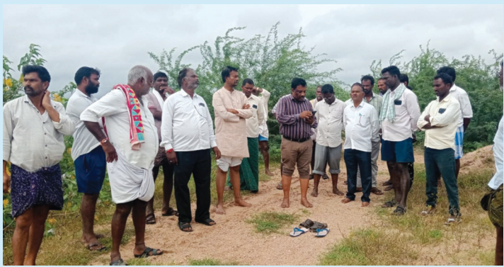
శ్రీరంగాపూర్/ వనపర్తి, సెప్టెంబర్ 02 (పేపుల్స్ మోటివేషన్):-