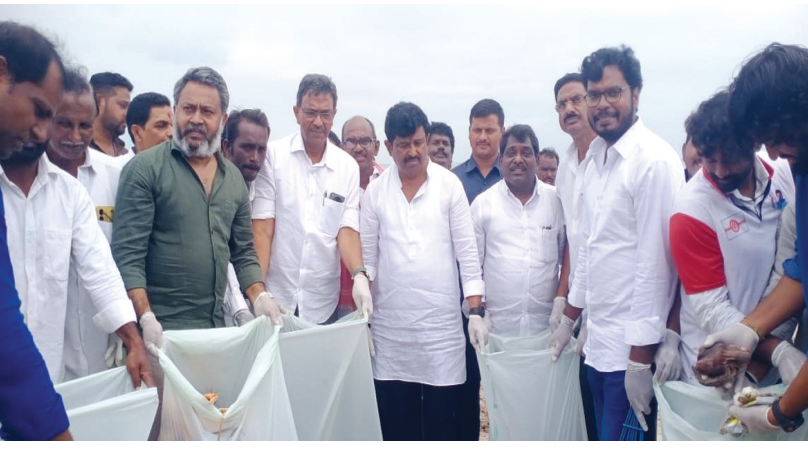
పలు కార్యక్రమాలు నిర్వహించిన జనసేన పార్టీ నాయకులు