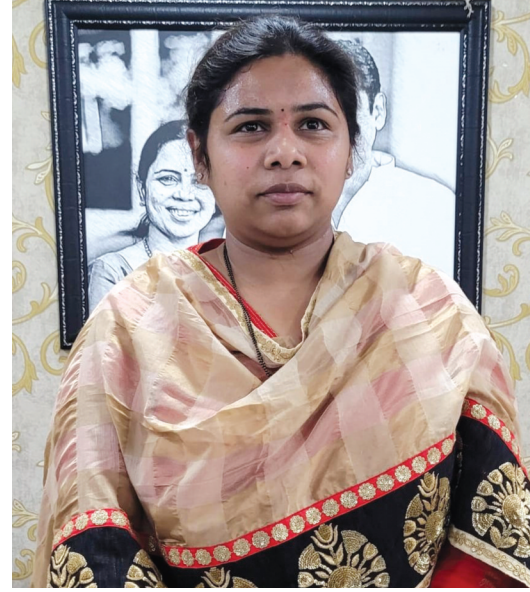
ఆళ్లగడ్డ, సెప్టెంబర్ 04 (పీపుల్స్ మోటివేషన్):-