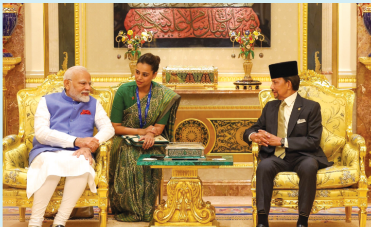
న్యూఢిల్లీ, సెప్టెంబర్ 4 (పీపుల్స్ మోటివేషన్):